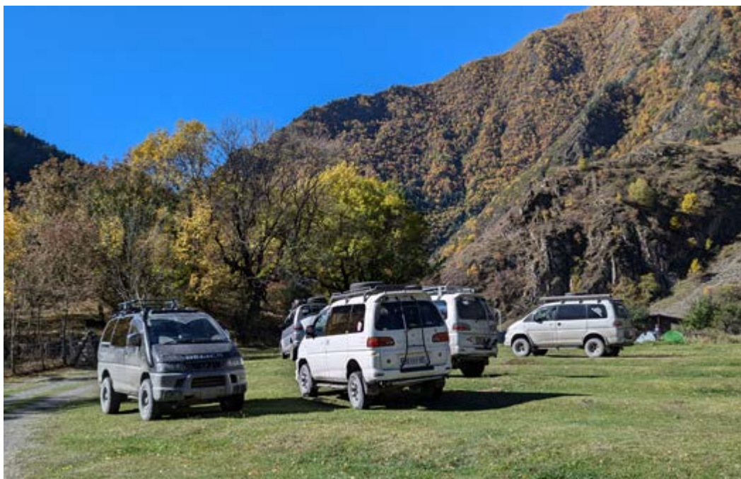
Nejoblíbenější dopravní prostředek v horách – dodávka Mitsubishi Delika. Pokud ji máš, můžeš se už vdávat (ženit).