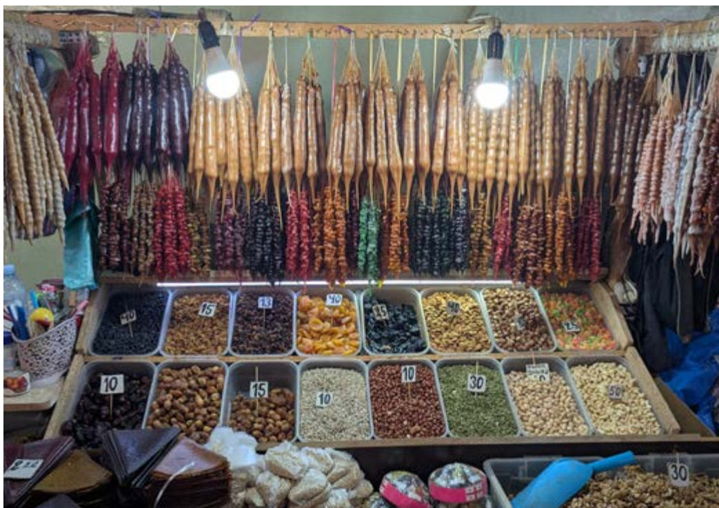
Stánek se sušeným ovocem, ořechy a čurčchelami (churchkhela), ořechy namáčenými ve vinném sirupu

jsou v Gruzii skoro všude. Národním zvykem a hlavní životní radostí je totiž dobře se najíst s přáteli. Nenajdete proto často jednotlivce u stolu, jako třeba u nás, obvykle jsou to větší skupinky, které si pronajímají salonky, případně sedí okolo velkých stolů. Standardní kvalitu najdete opět v řetězcích, jako je třeba Mačachela (Machakhela) či Pasanauri, ale restaurací jsou skutečně tisíce. Někde hraje živá hudba s gruzínskými tanci, jinde nabízejí krásný výhled na město nebo třeba skvělý design, stačí si jen vybrat.