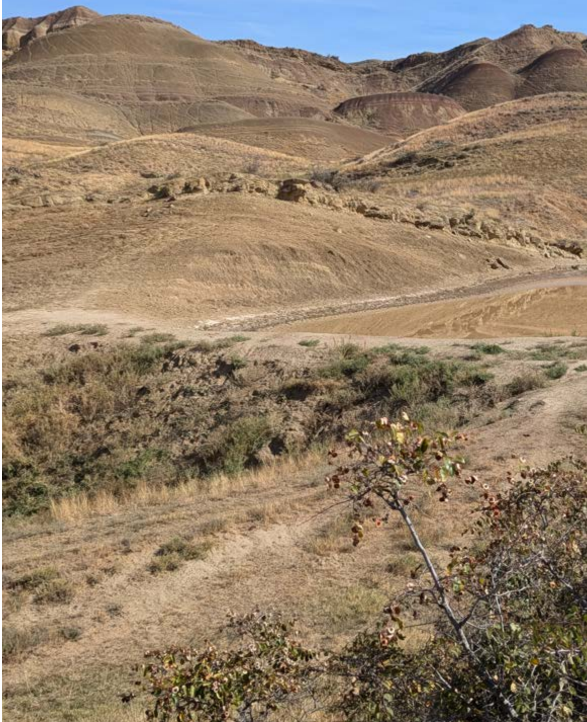
Říjen v Barevných (Duhových) horách