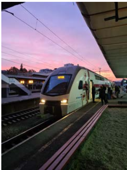
Dálková souprava mířící do Batumi

třeba se také obávat, že cestou zahy- nete hlady, když vlak nemá jídelní vůz a do Batumi jede asi 6,5 hodiny. Téměř na každé zastávce je možné od prodej- ců, kteří se tlačí do dveří, koupit něco k snědku.