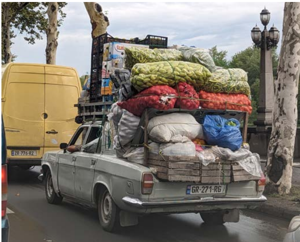
Co také potkáte na gruzínské silnici

Velmi dobrý způsob cestování je s místními řidiči. Je s nimi veselo, a pokud vás nevydělá svou většinou dost příšernou jízdou, dostanete se na místo určení rychle. Navíc často po- radí s ubytováním, jídlem apod. Dá se vyjednat, aby respektovali dopravní předpisy a omezili rychlost, ale budou z toho velmi rozpačití a moc to nebu- dou chápat.