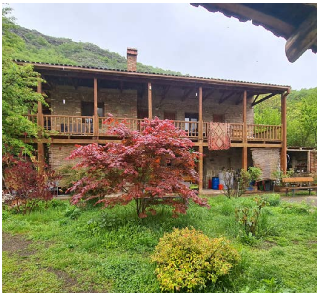
Typický guest house, rodinný penzion, kde rodina žije a část pronajímá.

Ve městech najdete i standardní hotely typu Radisson, Sheraton, Holiday Inn, Biltmore apod. Z nich je asi nejkrásnější designový hotel Rooms v Tbilisi, skvěle zařízený gruzínskými designéry.