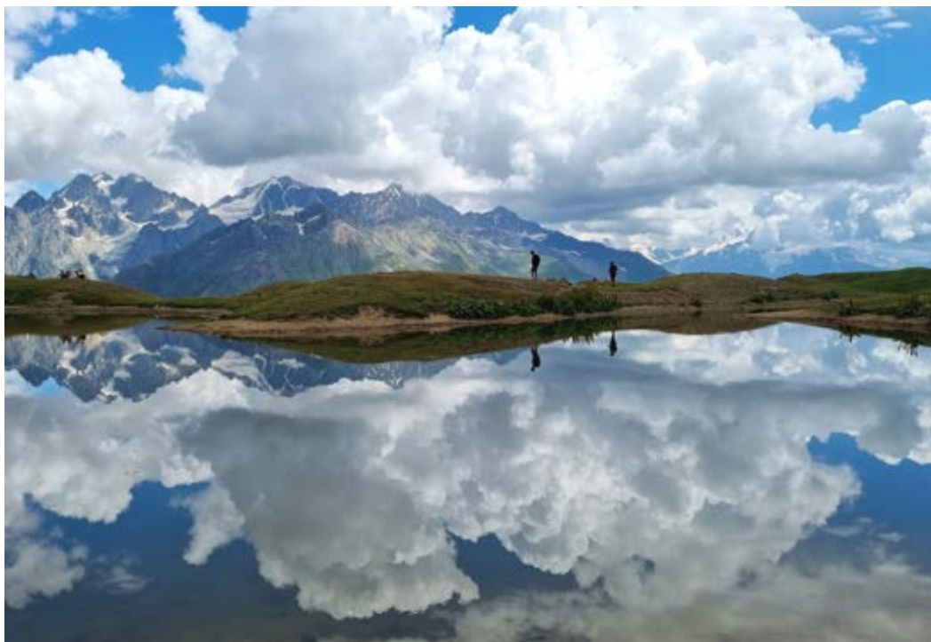
Jezera Koruldi ve Svansku