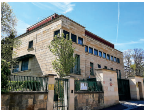
Pod Hradbami 17, Traubova vila (31)