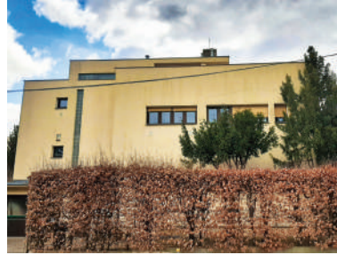
Matějská 19 (2)