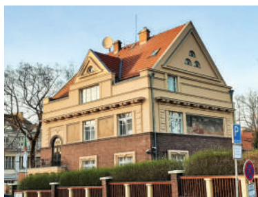
V Tišíně 10, Šimonova vila (6)