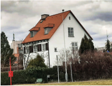
Matějská 42, Zupancova vila (1)