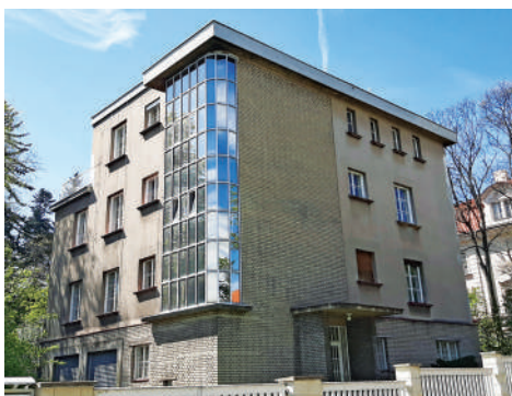
Pod Hradbami 13, Hamanova vila (32)