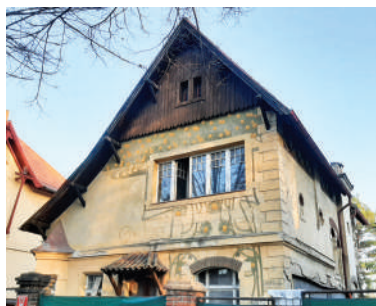
Slavíčková 9, Říhovského vila (16)