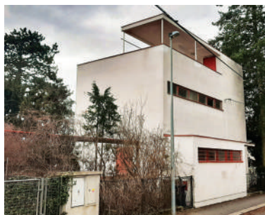
Na Babě 3, Herainova vila (29)