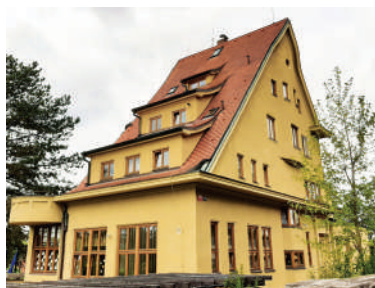
Nad Kazankou 30, Brabcova vila (3)