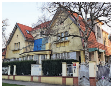
U Vorlíků 17, Heritesova vila (4)