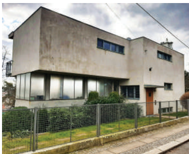
Na Babě 9, vila manželů Paličkových (23)