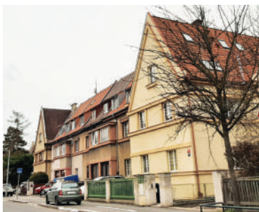
Řadové domy v ulici Na Pískách (8)