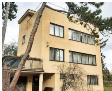
Na Babě 4, Bautzova vila (27)