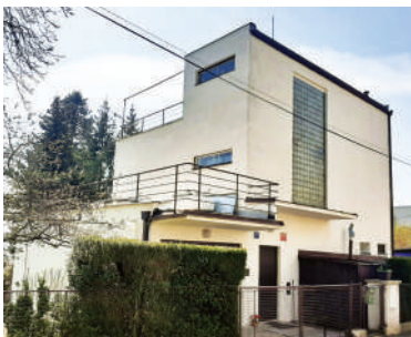
Na Babě 7, Heřmanova vila (24)