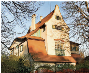
Suchardova 2, vila manželů Náhlovských (13)