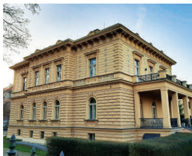
Slavíčková 91/14, Pelléova vila (19)