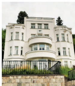
Nad Kazankou 27 a 29, vily Ondřeje Dlouhého a Vilmy Zlatníkové (5)