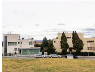
Neherovská 8, vila Lídy Baarové (5)