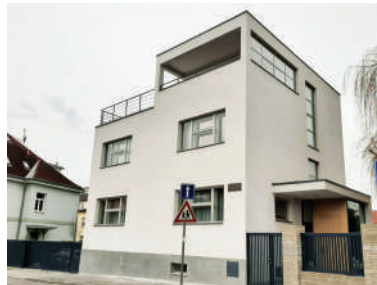
Za Hanspaulkou 15, Rathouského vila (7)