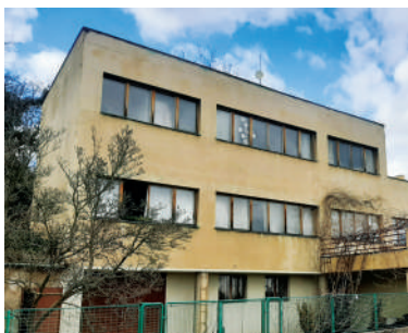
Nad Paňankou 22, vila manželů Kytlicových (33)