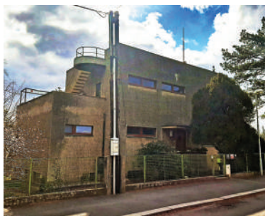
Na Ostrohu 53, Zadákova vila (17)