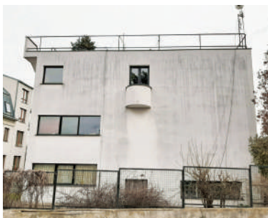
Na Viničních horách 46, vlastní vila Evžena Linharta (10)