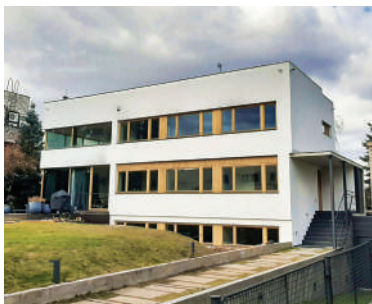
Na Ostrohu 54, Zaorálkova vila (12)