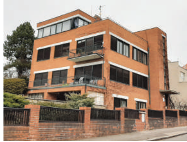
Na Míčánce 39 (2)