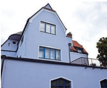
Na Špejcharu 3, Wilfertova vila (21)