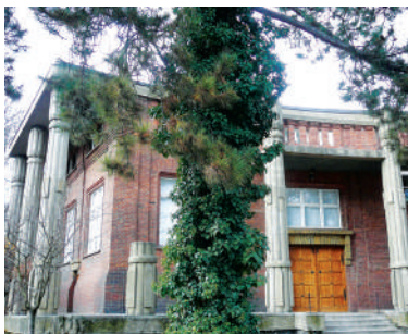
Mickiewiczova 1, Bílkova vila (22)