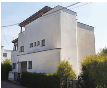
Na Ostrohu 45, vila manželů Jirouškových (10)