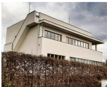
Na Babě 2, Glücklichova vila (28)