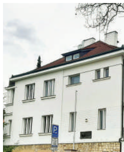
Kadeřávkovská 13, Burianova vila (16)