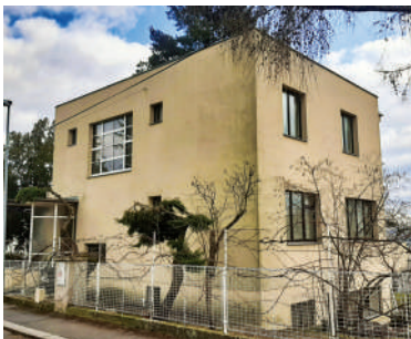
Na Babě 13, Uhlířova vila (20)