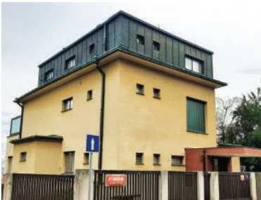
Fetrovská 4, Eliášova vila (6)