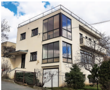
Na Babě 14, vila Miloslavy Lužné (19)