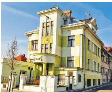
Krocínovská 3 (11)