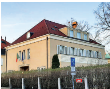
V Tišíně 2 (9)