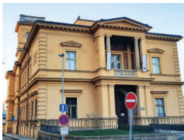
Pelléova 24, vila Vojtěcha rytíře Lanny ml. (1)