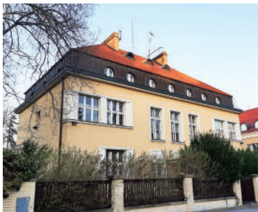
V Tišíně 4, Muchova vila (8)