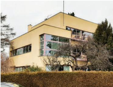
Na Špitálce 18, Mölzerova vila (4)