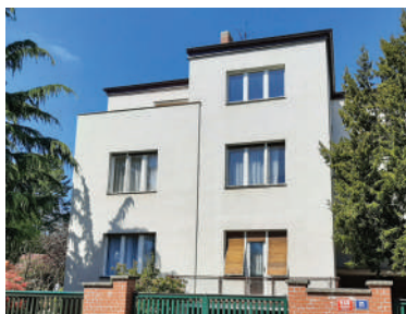
Slunná 21 (28)