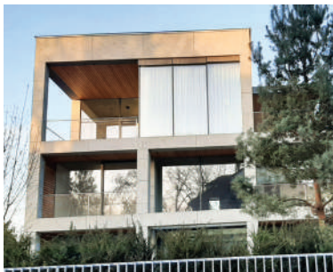
Romana Rollanda 8 (7)