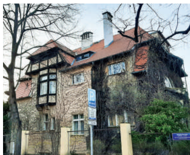
Suchardova 1, vila Stanislava Suchardy (14)