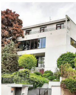
Trojská 134, Divišova vila (13)