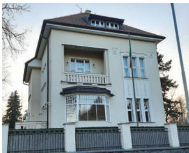
U Vorlíků 13 (12)