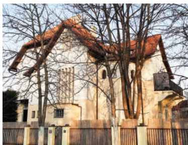
Pod Kaštany 18 (3)