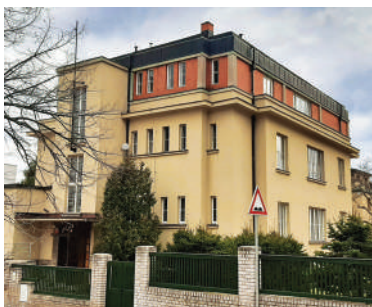
Na Hanspaulce 9, Kutlvašrova vila (9)