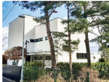
Na Ostrohu 41, Košťálova vila (6)