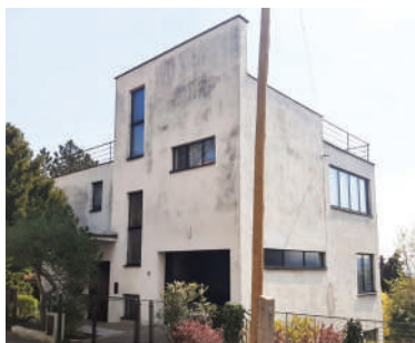
Na Babě 5, Ballingova vila (26)