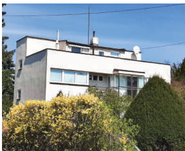
Na Ostrohu 50, dům manželů Lisých (9)