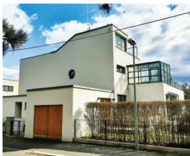
Na Ostrohu 51, Čeňkova vila (16)