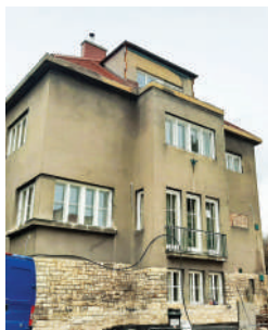
Kozlovská 5, Jakešova vila (15)