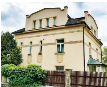
Nad Kazankou 16, vila manželů Kubínových (8)