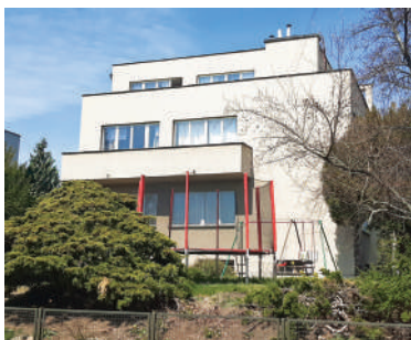
Na Ostrohu 48, Joskova vila (8)