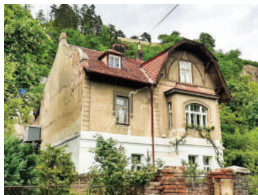
Povltavská 20 (1)