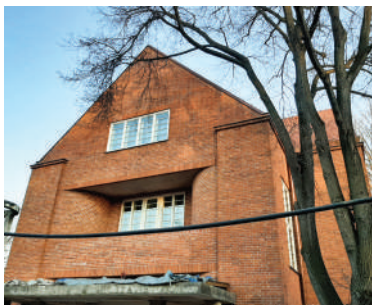
Na Zátorce 18, Kapsova vila (10)