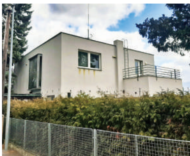
Na Babě 11, Špišková vila (21)