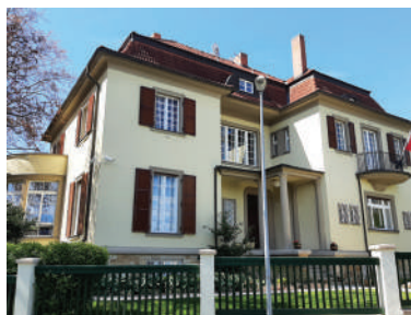
Slunná 23 (27)