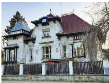
U Vorlíků 15, Kohlerova vila (5)