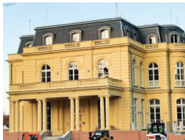
Petschkova rezidence (2)