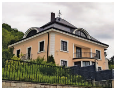
Nad Kazankou 31, dům manželů Fialových (4)