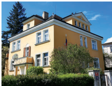
Slunná 25 (26)