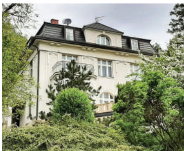
Nad Kazankou 13, Skorkovského vila (9)