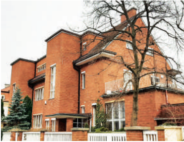
Na Míčánce 49-51 (1)