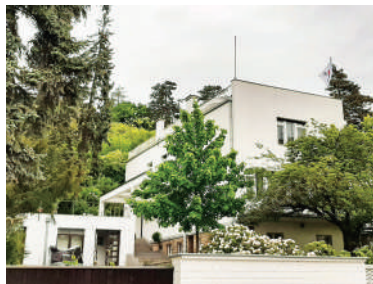
Nad Kazankou 39, Schückova vila (2)