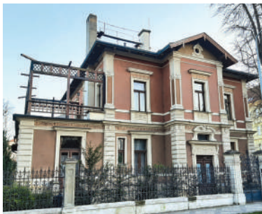
Slavičkova 21, vila Klementiny Koukolové (20)