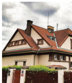
Nad Kazankou 22, Svobodova vila (7)