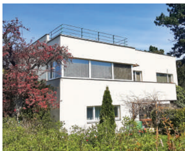
Na Ostrohu 60, vila manželů Munkových (18)