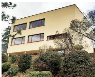
Nad Paňankou 28, Sutnarova vila (35)