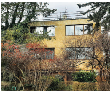
Na Babě 12, dům manželů Poláčkových (22)