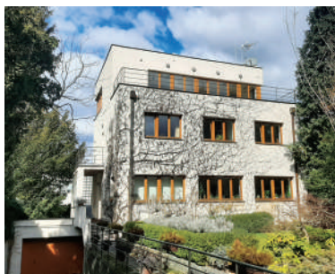
Na Ostrohu 56, dům Václava Řezáče (15)