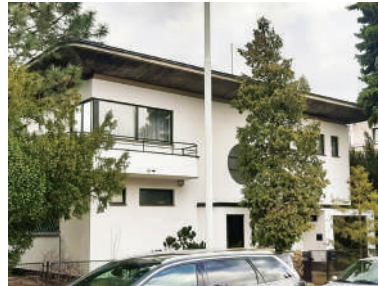
Matějská 9, vlastní dům Antonína Černého (4)