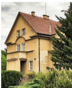
Trojská 118 (12)