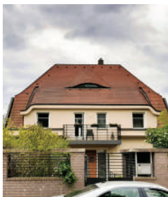
Nad Kazankou 28, Birnbaumova vila (6)