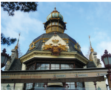
Hanavský pavilon (25)