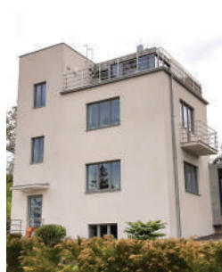
Nádvorní 6, Žoupalíkova vila (15)