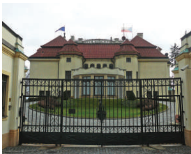
Kramářova vila (24)