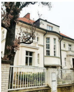
Na Karlovce 6, vlastní vila Antonína Engela (13)