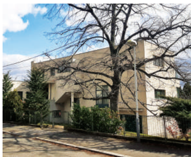
Na Ostrohu 49, Sukova vila (14)