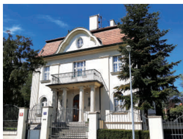
Slunná 15, Lippertova vila (29)