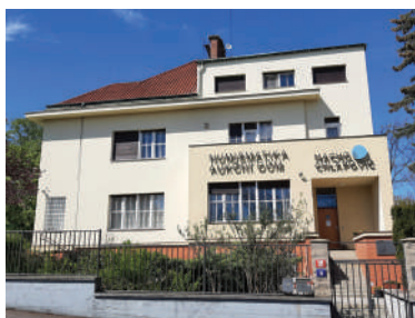
Slunná 11, Feierabendova vila (30)