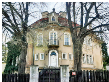
Slunná 29 (25)