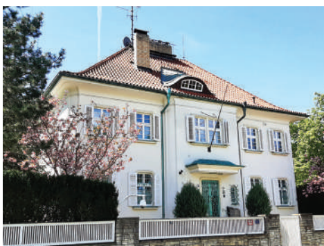
Dělostřelecká 1, Havlova vila (33)