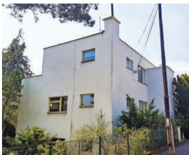
Na Ostrohu 43, Dovolilova vila (7)