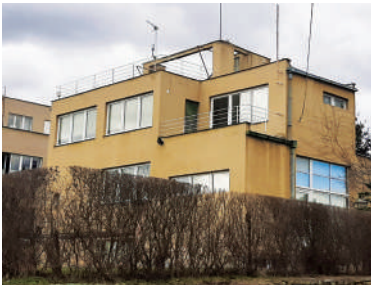
Na Ostrohu 46, Boudova vila (5)