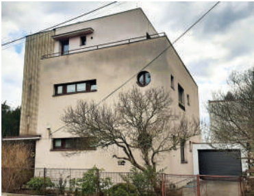
Matějská 11 (3)