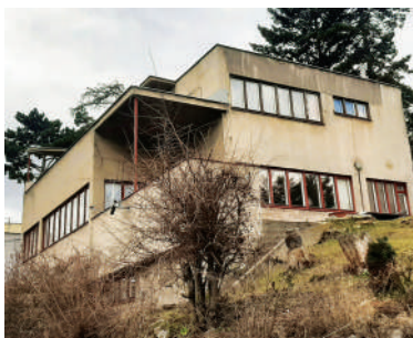
Nad Paňankou 24, Bělehrádkova vila (34)