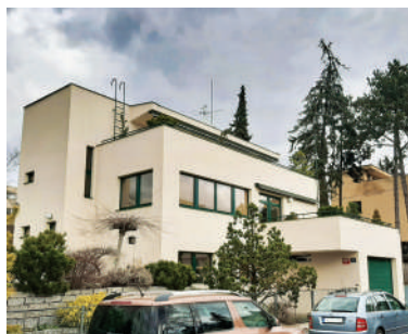
Na Babě 6, vila Václava Lindy a Pavly Lindové-Gutfreundové (25)