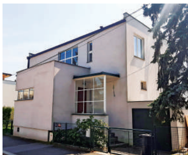
Na Ostrohu 47, Letošníková vila (13)