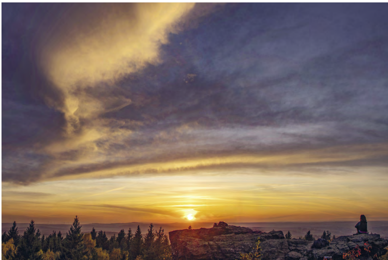
Západ slunce na Vysokém kameni