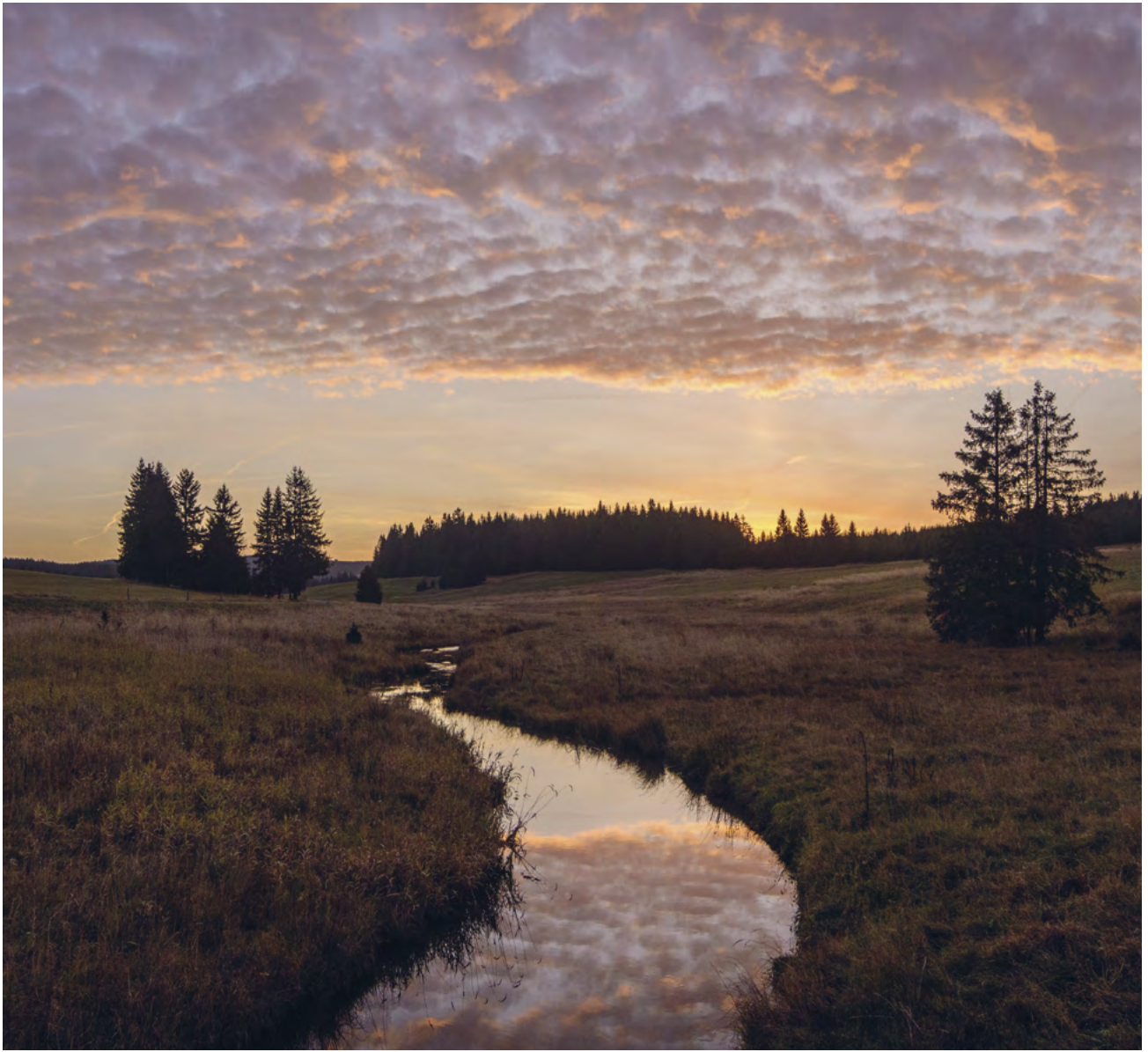
Svítání na Myslivnách