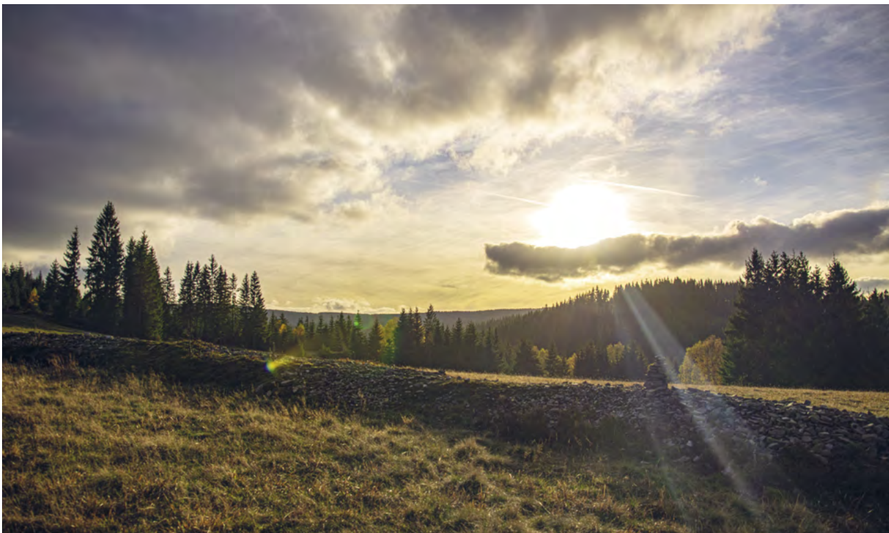
Kamenné snosy u Potůčků