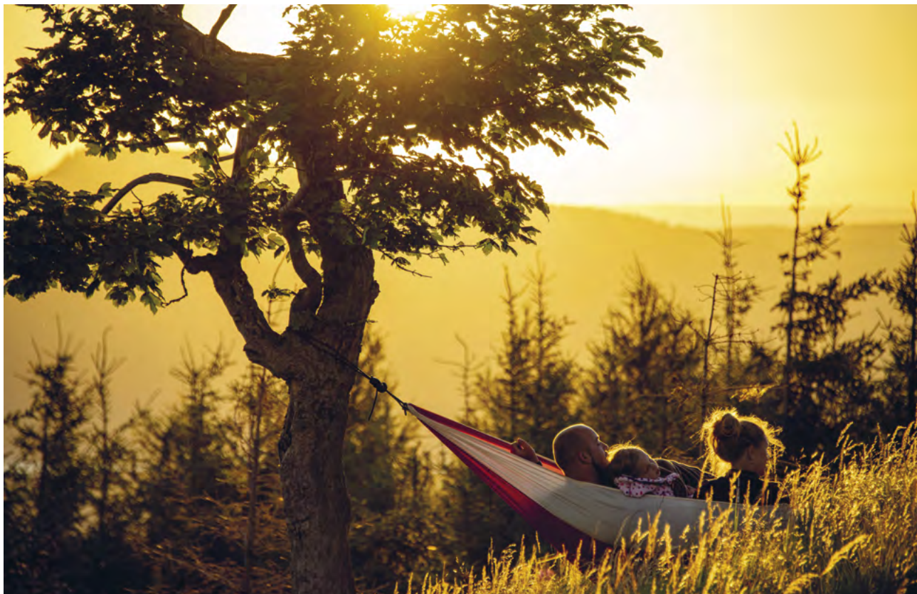
Itakto lze přenocovat na Velkém Špičáku u Kovářské

spacáků. Kdo mne na výletu zažil, ví, že chodím v poslední době spát jako první a jako první vstávám. Večer bývám dost unavený a nechci si nechat ujít ty krásně oleželé, oteklé tváře po ránu. Zašmodrchané vlasy a ospalky holek, chřaplavé hlasy po probuzení, ranní nadávky na noční zimu, radost z východu slunce a teplého hrnku kávy.