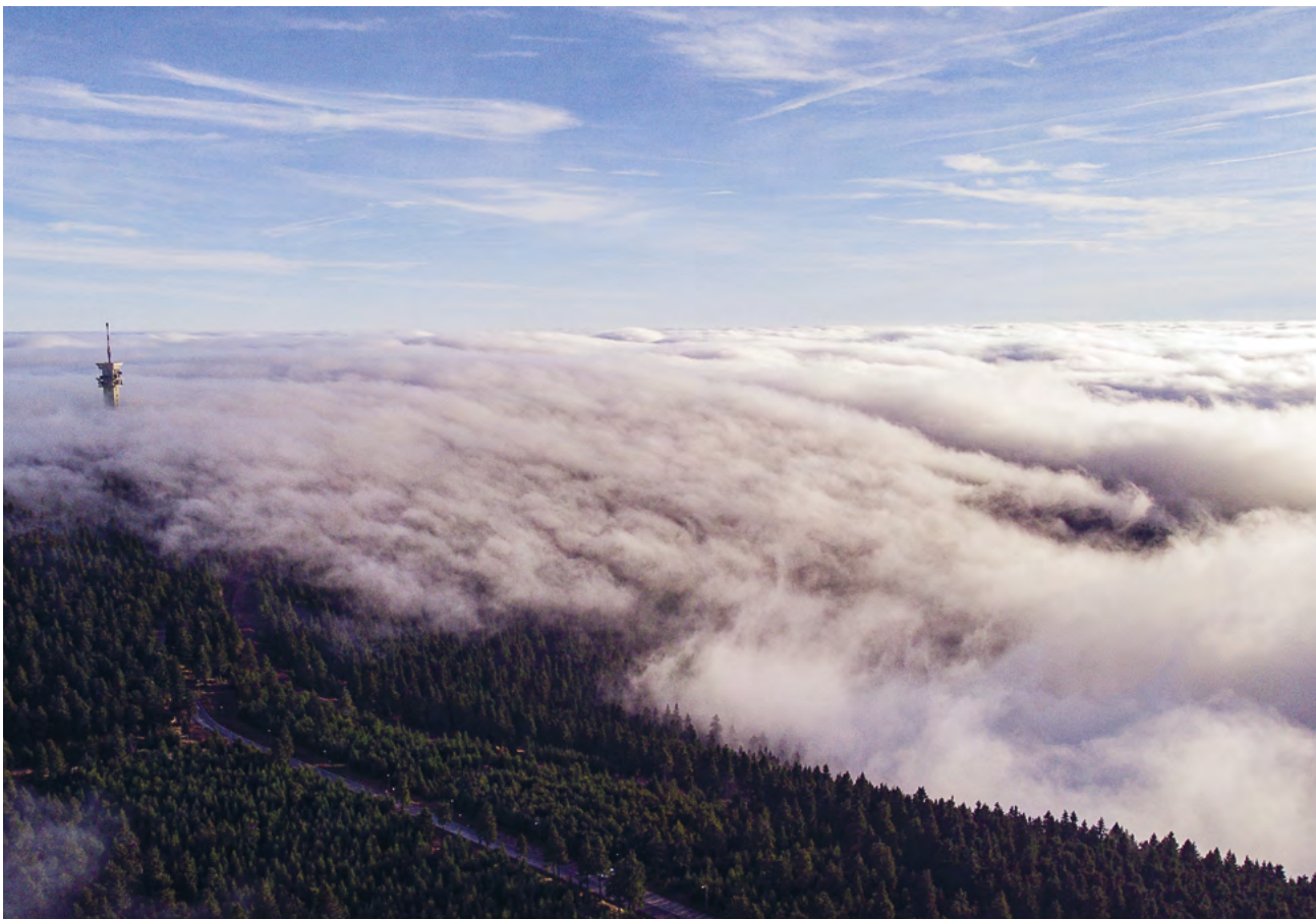
Mlha se převaluje přes vrchol Klínovce