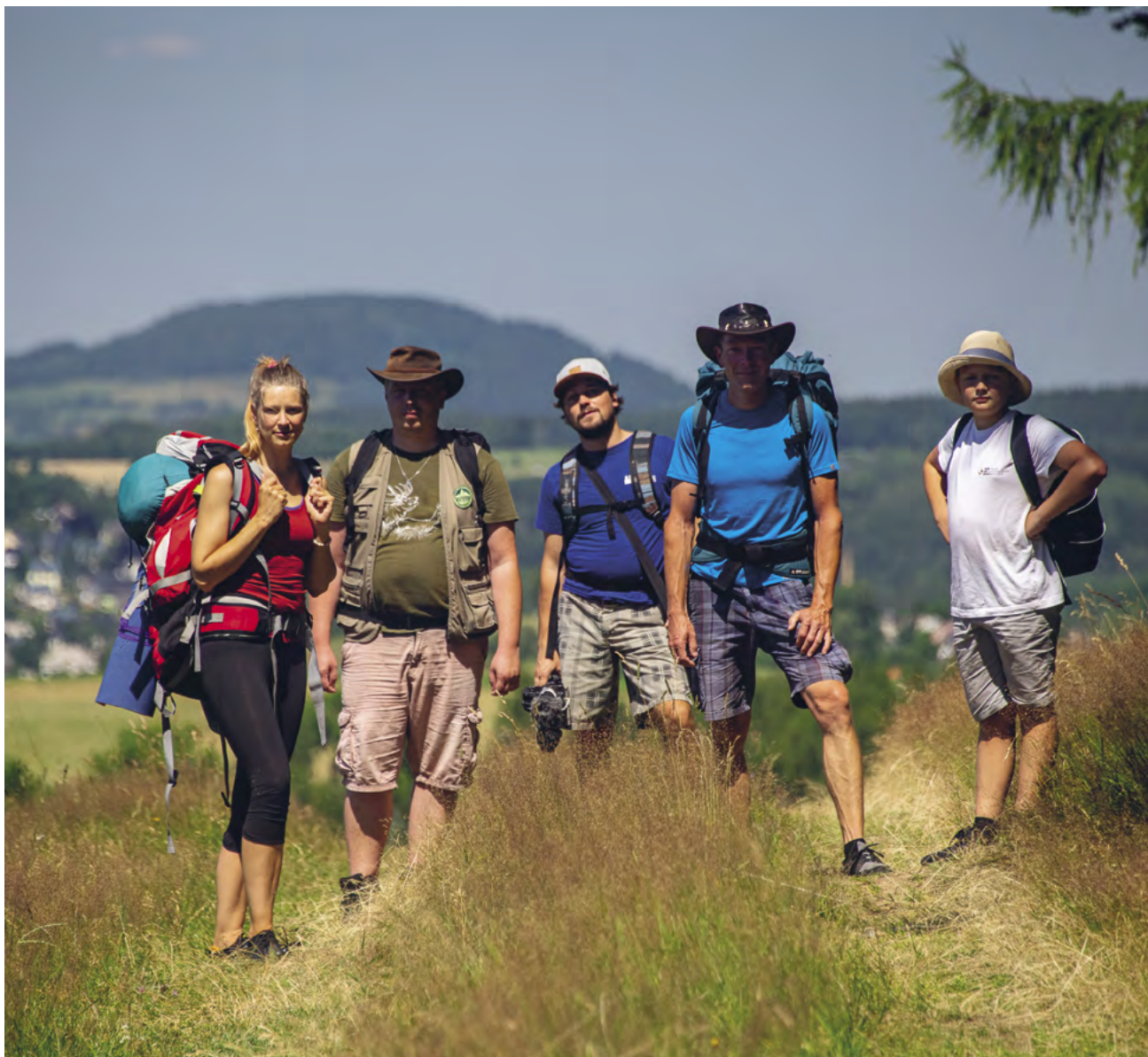
Vzhůru na Velký Špičák!