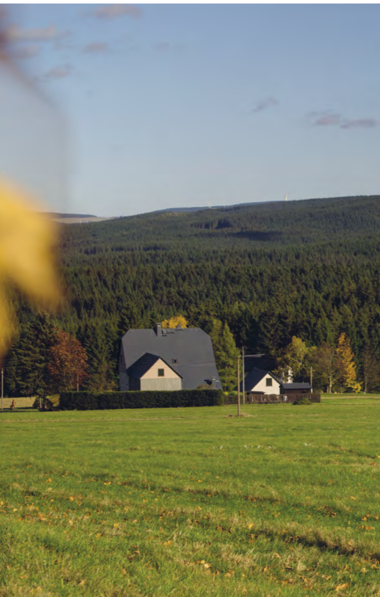
Podzimní nálada v okolí Johanngeorgenstadtu