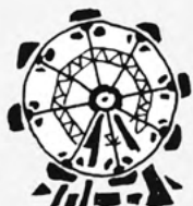
RUSKÉ KOLO FÉNIXOVA LETIŠTĚ