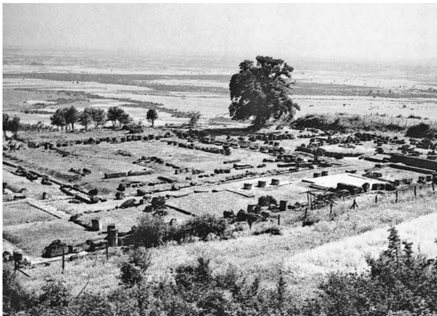
Zbytky královského paláce v Aigách.

sbor druhů bojujících pěšmo (pezetairové). Postaral se zároveň o dokonalé vyzbrojení bojovníků meči, oštěpy, štíty, ochrannými krunýři a přilbami. Zajistil pro vojsko dostatek koní, vozů i válečného materiálu. Dal vybudovat síť cest a pevností. Zdokonalil tak dosažitelnost kterékoli oblasti svého státu. Zpevnil zároveň správu celé země a závislost okrajových podrobených kmenů na své ústřední moci. Na rozhraní století byl již schopen podnikat válečné výboje k rozšíření územní rozlohy svého království, když dobyl Thessalii a podrobil si chalkidický kmenový svaz.