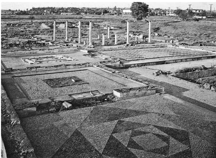
Zbytky královského paláce v Pella.

z jeho vůle vzniklo nové hlavní město Pella, přibližně na půl cesty mezi Edessou a osmdesát kilometrů vzdálenou Soluní. (Z někdejšího lidnatého města ovšem dnes zbyly divokou vegetací zarostlé ruiny, které teprve v roce 1956 začaly odkrývat krumpáče a lopaty archeologů. Vykopávky dokazují, že město bylo budováno plánovitě podle helénského vzoru, s pravidelně vytyčenou sítí pravouhle se protínajících ulic. Byly objeveny zbytky důmyslné kanalizace a keramické trubky přivádějící vodu do nádrží v jednotlivých čtvrtích. Odkryté sloupy a mozaikové podlahy svědčí o výstavnosti rozlehlého královského paláce.)