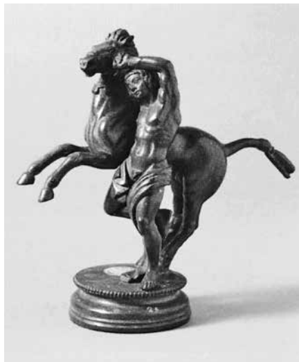
Soška znázorňující zkrocení Búkefala.

Búkefalos se stal na příštích téměř dvacet let stálým společníkem Alexandra, zejména v bojích a bitvách jeho vladařské a vojevůdcovské éry.