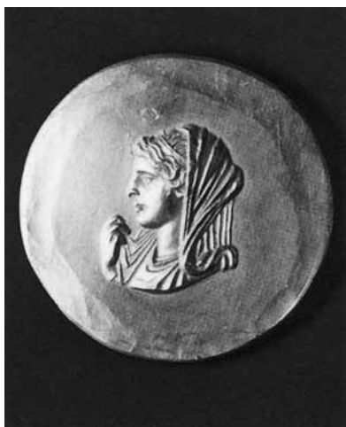
Olympias, manželka krále Filipa.

V té době si král Filip vybral již svou třetí manželku. Volba padla na princeznu Myrtalé z épeirské královské dynastie Molossů, nazývanou Olympias. Byla sestřenicí krále Épeiru Arryba, takže sňatek s ní sliboval