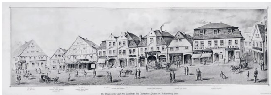
Severní strana náměstí Dr. E. Beneše (tehdy Staroměstského) v polovině 19. století (archiv Jaroslav Hůlka)

Jižní průčelí náměstí tvoří od založení šest domů. Odlišným vzhledem je dodnes nápadný dům č. p. 1 na nároží Moskevské ulice, zvaný Hlasivcův. Původní dřevěný právovárečný dům koupil lékárník Kittel v roce 1792 a o deset let později zde postavil zděný dvoupatrový dům, kam přemístil i lékárnu, která zde přečkala dvě světové války a pak byla přemístěna o dva domy vedle.