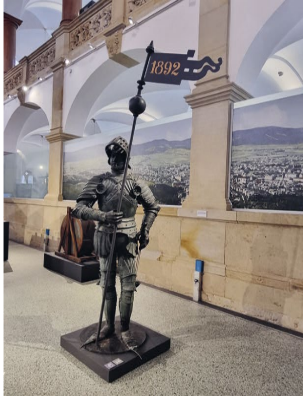
Originál sochy rytíře je nyní vystaven v muzeu.