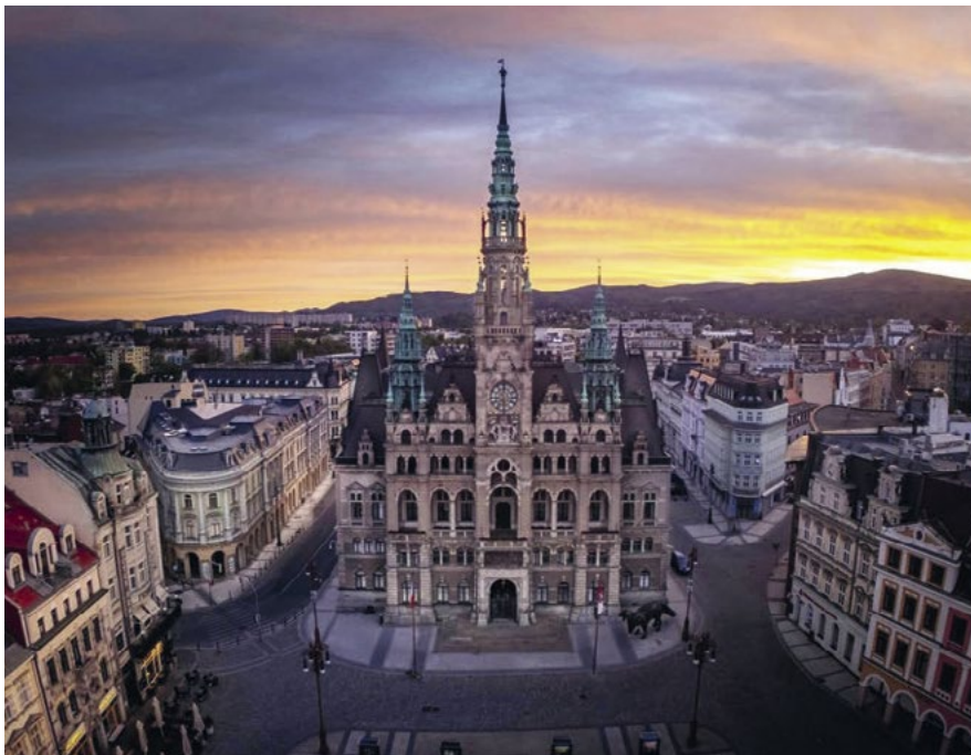
Liberecká radnice