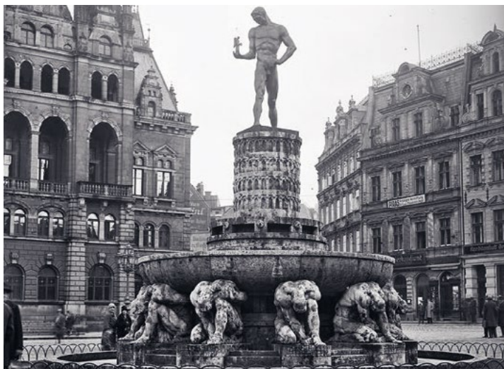
Metznerova kašna v roce 1928