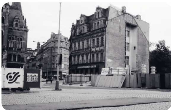
Náměstí Dr. E. Beneše kolem roku 1985 a 2020