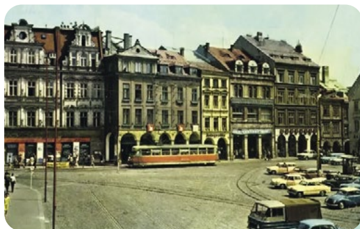
Náměstí Dr. E. Beneše kolem roku 1965 a 2020