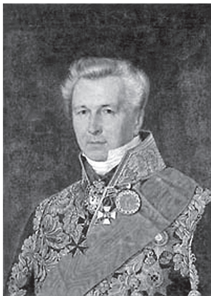
Ruský vyslanec u britského královského dvora R. Brunnov

Vraťme se o pár let zpět. Jen deset minut chybělo do desáté hodiny v sobotu 1. června 1844 a nad Temží zavlály vlajky s černým dvojhlavým orlem. Jeho imperátorská Výsost, car všech Rusů Mikuláš I., právě dorazil na návštěvu své sestřenice, Její královské Výsosti královny Viktorie, královny Spojeného království Velké Británie a Irska.