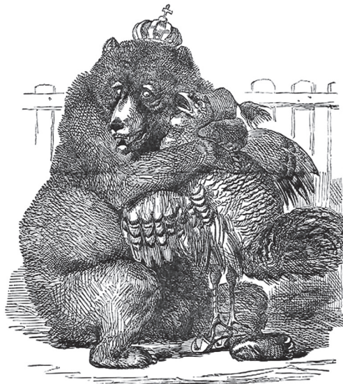
Turecký krocan v objetí ruského medvěda

Nejdříve vysvětlil car svůj postoj k francouzskému králi těmito slovy: „Ludvík Filip je pro Evropu požehnáním, s tím upřímně souhlasím. Ale já nikdy nebudu jeho přítelem... Vždyť aby si získal svou pozici a udržel se v ní, pokusil se podkopat naopak mou jako ruského vládce a to mu nikdy nezapomenu.“