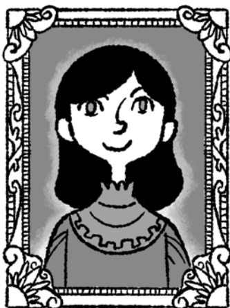
MINA MURRAYOVÁ Jonathanova snoubenka