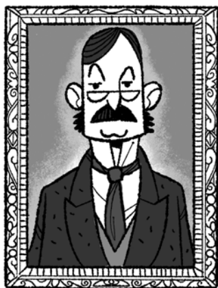
DR. SEWARD lékař