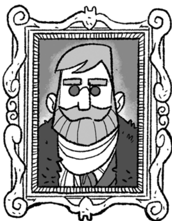
ABRAHAM VAN HELSING přítel dr. Sewarda