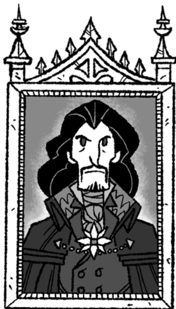
HRABĚ DRACULA tajemný rumunský šlechtic