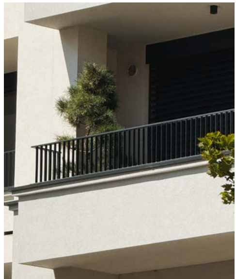
Balkonové pěstování lze ale pojmout i velmi minimalisticky.