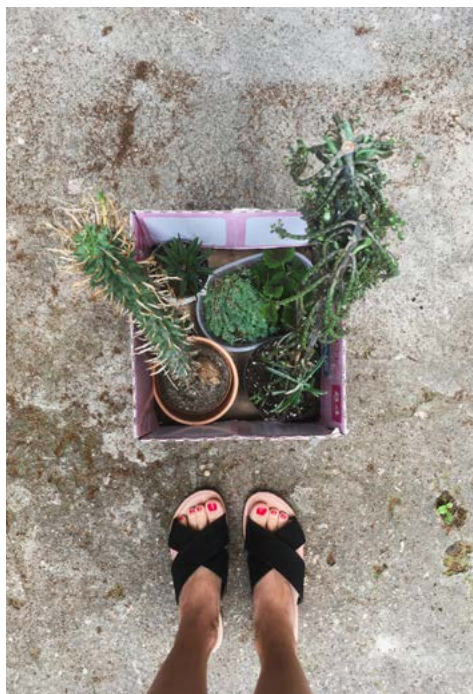
Na začátku bylo jen pár vyswapovaných rostlin v krabici od dětských plen.

At' už se vám to líbí, nebo ne, na balkon nebo terasu se vám nevejde úplně všechno. V závislosti na tom, s jak velkým (nebo malým) prostorem pracujete, si budete muset zvolit alespoň rámcově, jakým směrem se vydáte. Dobrá zpráva je, že nic není neměnné. Život se žije, nároky se mění. Nenechte se paralyzovat tím, že nemáte úplně jasno. Možná jste typ, který potřebuje prostě nějak začít... a ten zbytek se ukáže cestou.