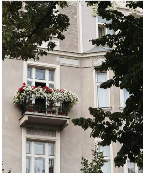
Rozkvetlý balkon je sen mnoha lidí.

Minimalistický prostor jako od designéra s puncem luxusu, nebo spíše veselé barvy a hravé kombinace? Funky interiér s nádechem urban jungle, nebo tradiční muškáty a dekorace? Hygge koutek jako