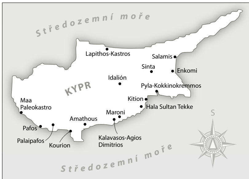
Mapa 4: Kypr v době železné, s lokalitami a oblastmi zmíněnými v textu