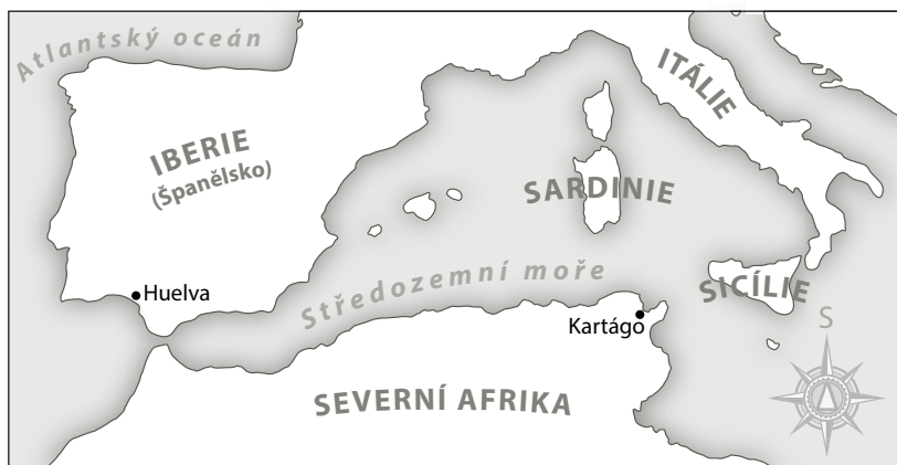
Mapa 5: Západní Středomoří v době železné, s lokalitami a oblastmi zmíněnými v textu