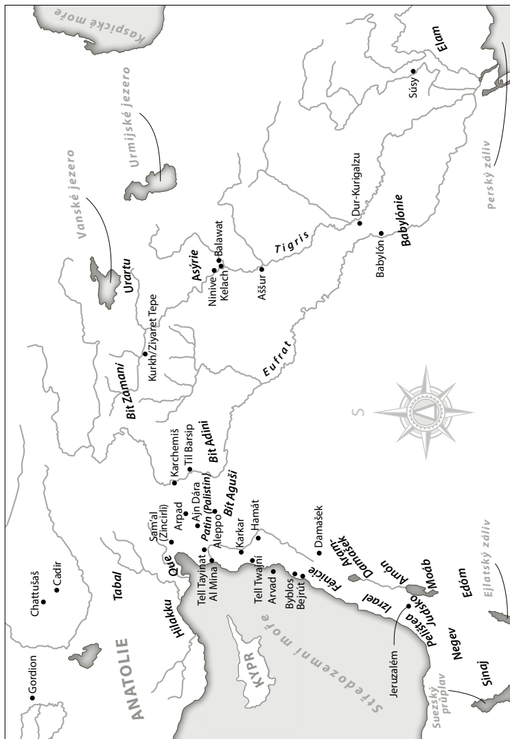
Mapa 1: Doba železná ve východním Středomoří, znázorněny jsou novochetitské, aramejské a mezopotámské lokality, království jižní Levanty jsou identifikovány (ale ne všechna jsou uvedena)