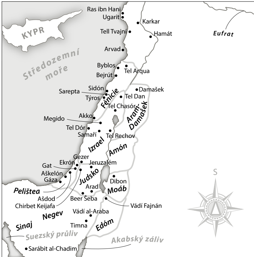
Mapa 3: Levanta v době železné, s lokalitami a oblastmi zmíněnými v textu