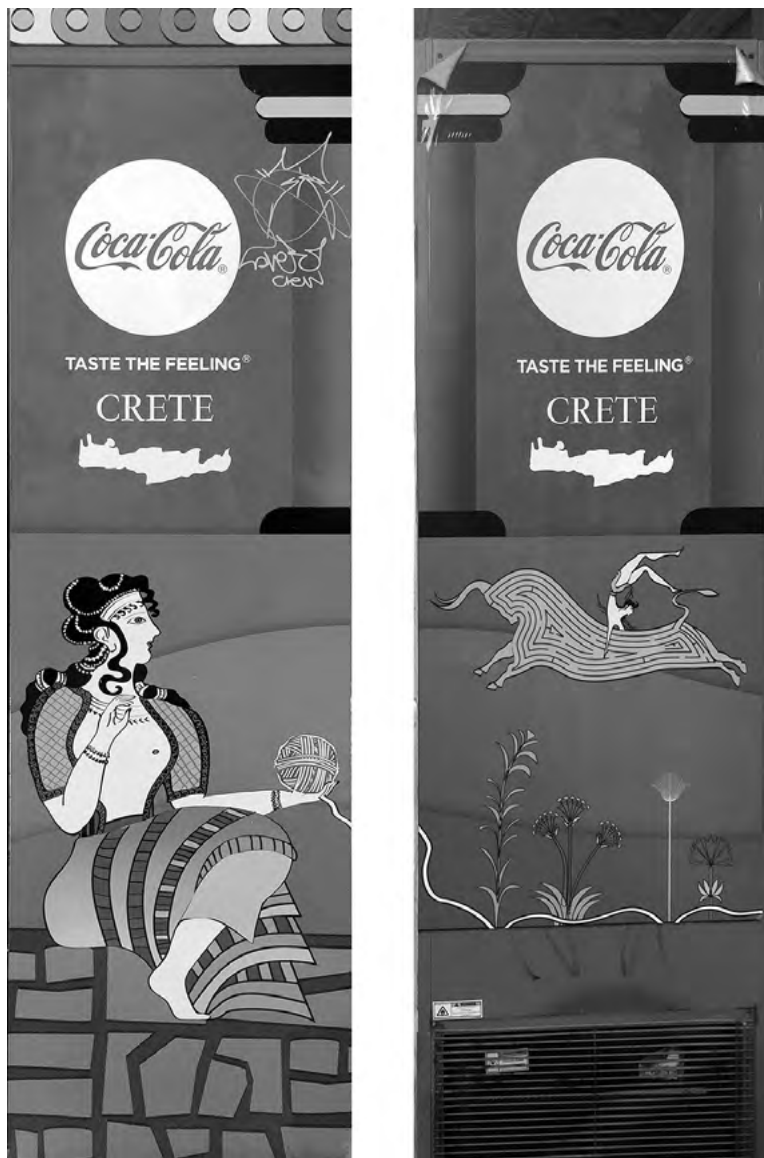
Obr. 1: Automat na Coca-Colu ve městě Rethymno na Krétě.