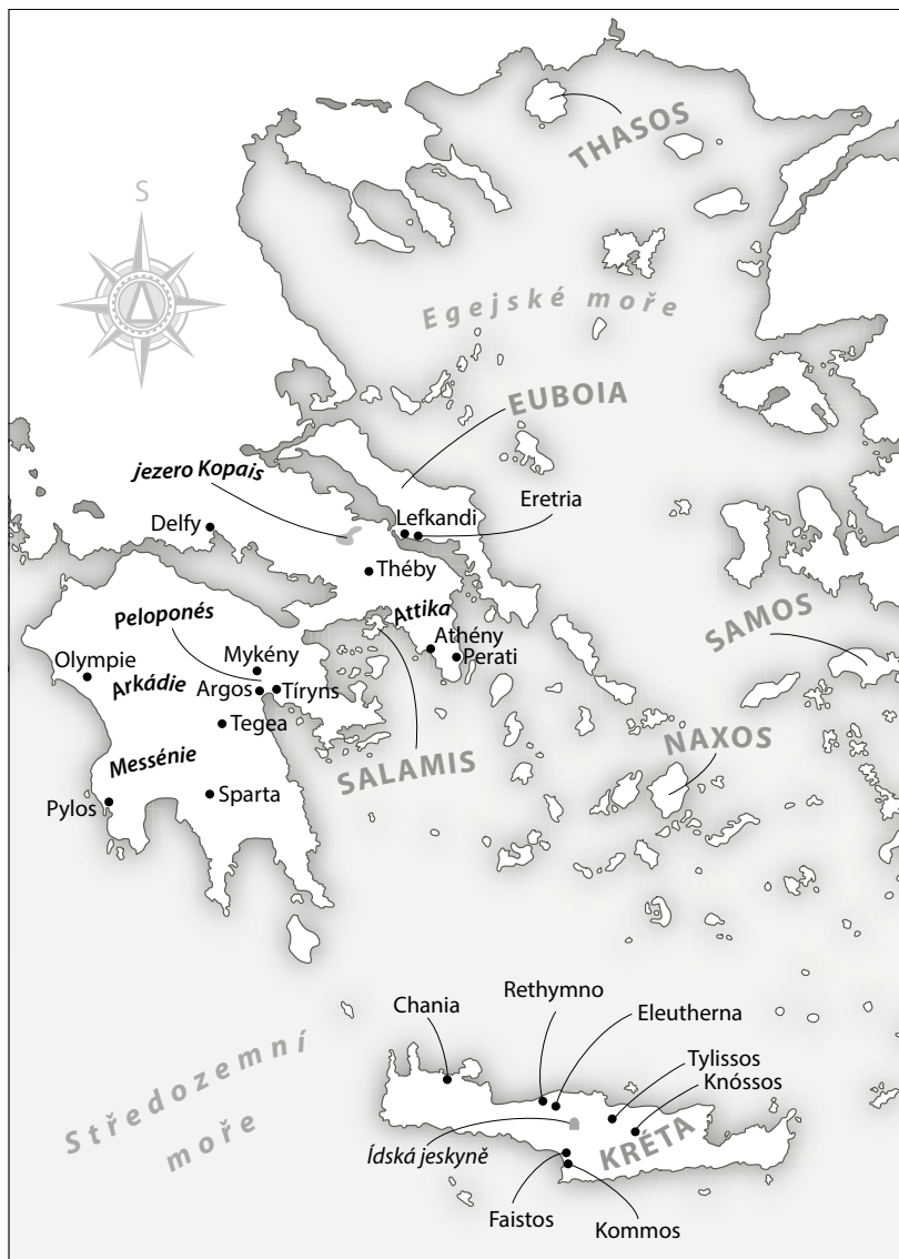
Mapa 6: Egejská oblast v době železné, s lokalitami a oblastmi zmíněnými v textu