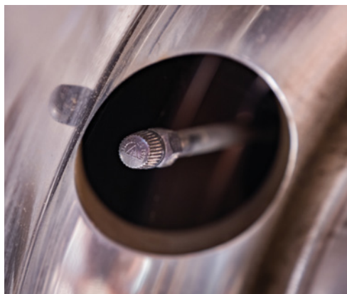
Ventilek vnitřní pneumatiky u dvojmontáže je lehce přístupný.