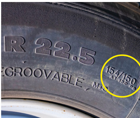
Maximální tlak, na který je pneumatika konstruována, je uveden na pneumatice.

Kontrolu provádíme tlakoměrem. Pozor, tlakoměry používané pro osobní vozidla zde většinou nelze použít.