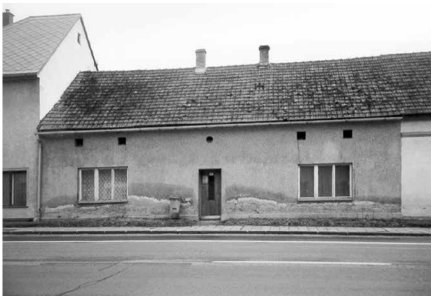
Obr. 1 Pohled na průčelí domu s viditelnou vlhkostní mapou

příčiny nadměrné vlhkosti stavebních konstrukcí. Teprve pak je možno odborně navrhnout komplexní sanační zásah.