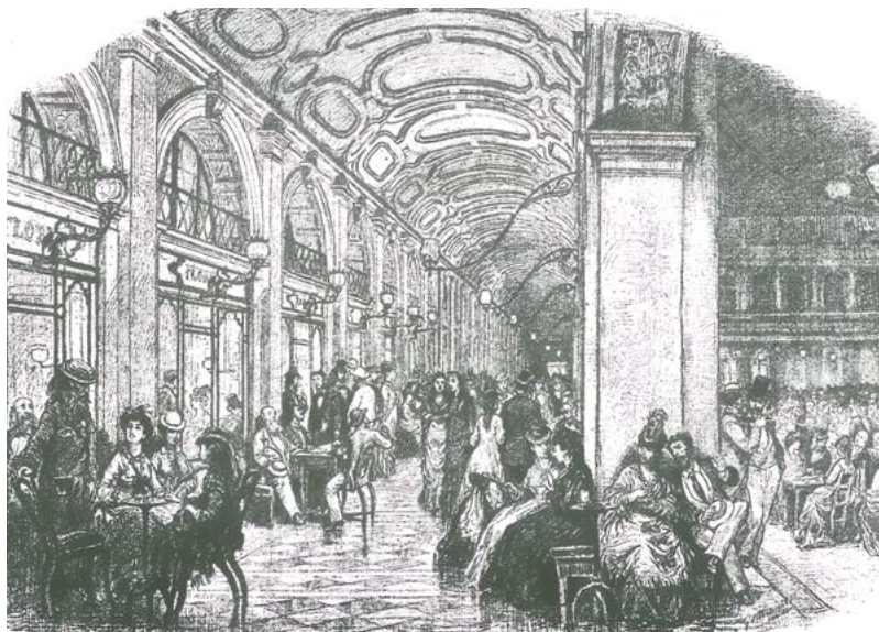
Caffè Florian v Benátkách patří mezi nejstarší evropské kavárny

připravovaný filtrací nebo louhováním. Na konci 19. století se zrodilo espresso , které později ovládlo svět. Italové tradičně podávali kávu malou, silnou a bez mléka. Cappuccino nebo latte se pilo hlavně ráno, nikdy však odpoledne!