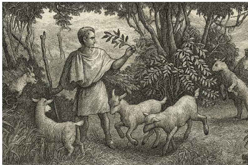
Byl Kaldi díky svým kozám první, kdo poznal účinky kávových zrn

Nejznámější pověst o původu znalosti pražení kávy byla roku 1671 zachycena písmem křesťanského kněze Faustusem Naironou (1628–1711). Stalo se tak v době, kdy