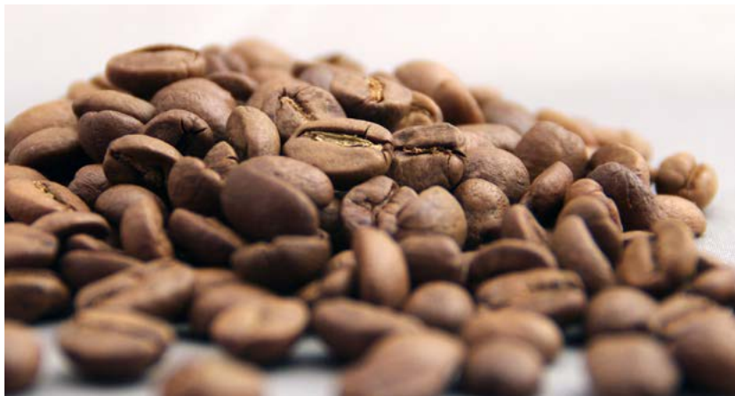
Pražená kávová zrna odrůdy, kterou známe jako arabicu