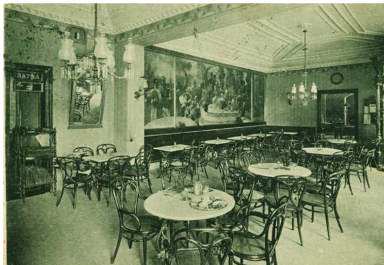
Interiér pražské kavárny Slavia v sousedství Národního divadla, počátek 20. století

Na Moravě a ve Slezsku se káva šířila postupně z Vídně a Brna. Brno jako „vídeňské předměstí“ disponovalo kavárnou dříve než samotná Praha. První improvizovaná kavárna zde vznikla již roku 1702, ovšem prvním stálým kavárenským podnikem se stala kavárna Turka Achmeta, jemuž kavárenskou koncesi udělila brněnská městská rada, protože se za něj přimluvil sám vídeňský arcibiskup a také proslulý obránce hlavního města monarchie právě před Turky hrabě Kollonitsch. V roce 1717 byly v Brně již tři měšťanské kavárny a za další dva roky jich bylo dokonce šest. Kavárny v Olomouci , Opavě , Ostravě či Přerově začaly vznikat zejména v závěru 19. století, kdy se města