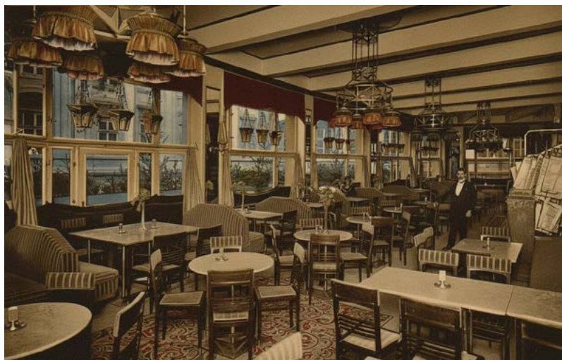
Jediná kubistická kavárna v Evropě: To byla a opět je pražská kavárna Orient

industrializovala a rostl počet úředníků, studentů a obchodníků, kteří oceňovali prostředí kavárny kvůli práci i odpočinku. Češi dlouho preferovali jednoduchý způsob přípravy známý jako „turek“ – mletá káva se zalila horkou vodou a nechala usadit. Tento styl převládal až do konce 20. století. V měšťanských domácnostech se káva často podávala s mlékem nebo smetanou a později ve stylu vídeňské kávy se šlehačkou. V kavárnách se objevovala i filtrovaná káva či moka konvičky, nicméně espresso se v českých zemích výrazně rozšířilo až po roce 1989. Dnes je česká káva pestrá – od tradičního turka až po moderní metody jako aeropress nebo chemex. A jak víme, v poslední dekádě se do mnoha českých domácností dostal také domácí kávovar.