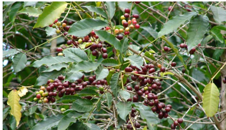
Plody kávovníku arabica

jmout, rozemlít a smíchat s horkou vodou. Tento příběh – ať už je pravdivý, či nikoliv – krásně ilustruje, jak mohl vzniknout nápoj, který dnes známe jako kávu . Jedna z pověstí také vypráví, že jednou zachvátil les na pahorcích Kaffa požár a v nepříjemném zápachu ohně se objevila delikátní vůně. Jeden z mnichů posbíral plody spadlé z ohořelých keříků, semena rozemlel, zalil horkou vodou a takto vznikla první „pražená“ káva. Pražení zrn umožnilo jejich rozemletí na prášek a mnohem lepší chuťový požitek.