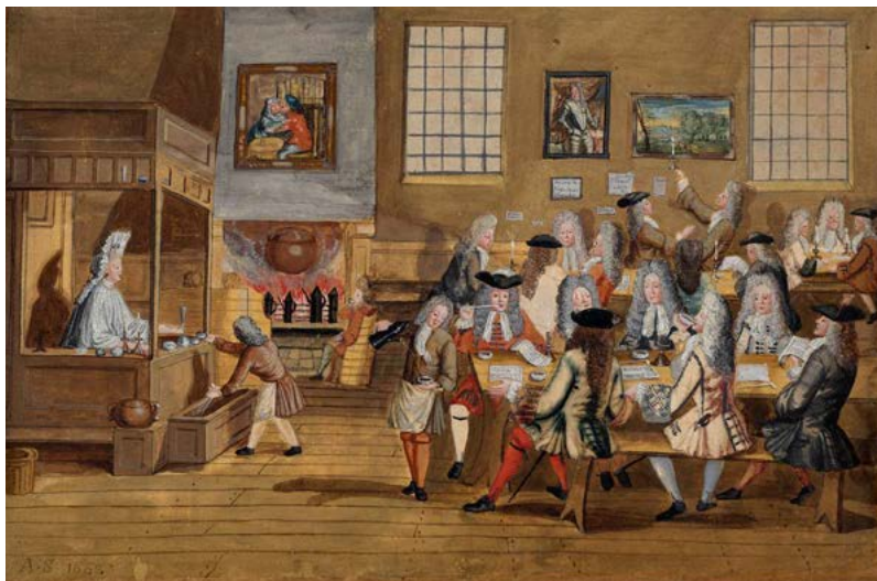
Interiér londýnské kavárny, obraz z roku 1668