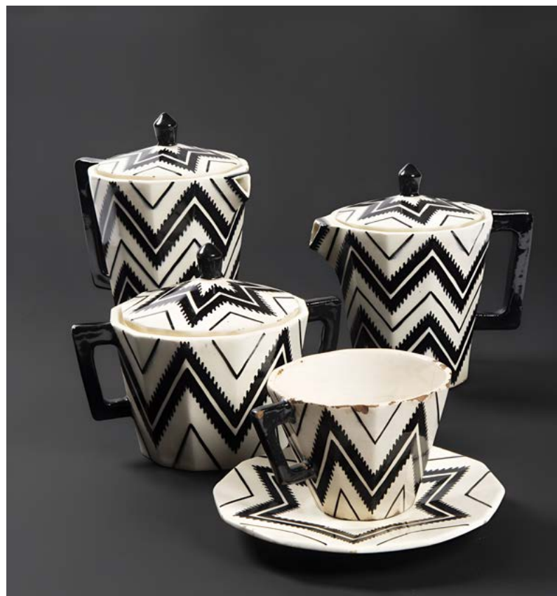
Káva ovlivnila také užité umění. Díky konzumaci hořkého nápoje začaly již v 19. století vznikat kávové servisy. Na snímku servis z roku 1912 navržený Pavlem Janákem v kubistickém stylu

Zázračný, ďábelský, povzbuzující, vítaný i zakazovaný nápoj – tak byla káva v různých dobách nazývána. Během posledních čtyř staletí zaplavila pražená kávová zrna díky cestám po souši i moři celý svět a stala se neoddělitelnou součástí kulturní i společenské historie lidstva.