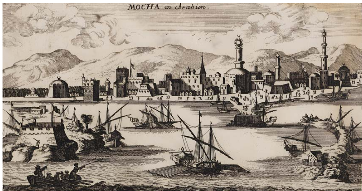
Pohled na jemenský přístav Mokka, litografie z roku 1690

Z Etiopie vedly kroky kávy na Arabský poloostrov, zejména do Jemenu, odkud se káva rozšiřuje do okolních regionů již okolo roku 1200. Kolem 15. století se zde káva začala cíleně pěstovat. Arabští obchodníci měli výhodnou pozici díky přístavu Mokka, odkud vyváželi kávu do celého islámského světa. Mokka si brzy vysloužila slávu srovnatelnou s nejvýznamnějšími přístavy Evropy a dodnes nese její jméno typ kávových zrn i čokoládovo-kávový nápoj. Z přístavu Mokka se kávová zrna vyvážela do osmanské říše, kde spatřily světlo světa také první kávové plantáže a byla zde vynalezena moderní technika pražení kávy. Centrem kávové kultury se brzy stala Konstantinopol, v níž kolem roku 1550 vzniká první kavárna.