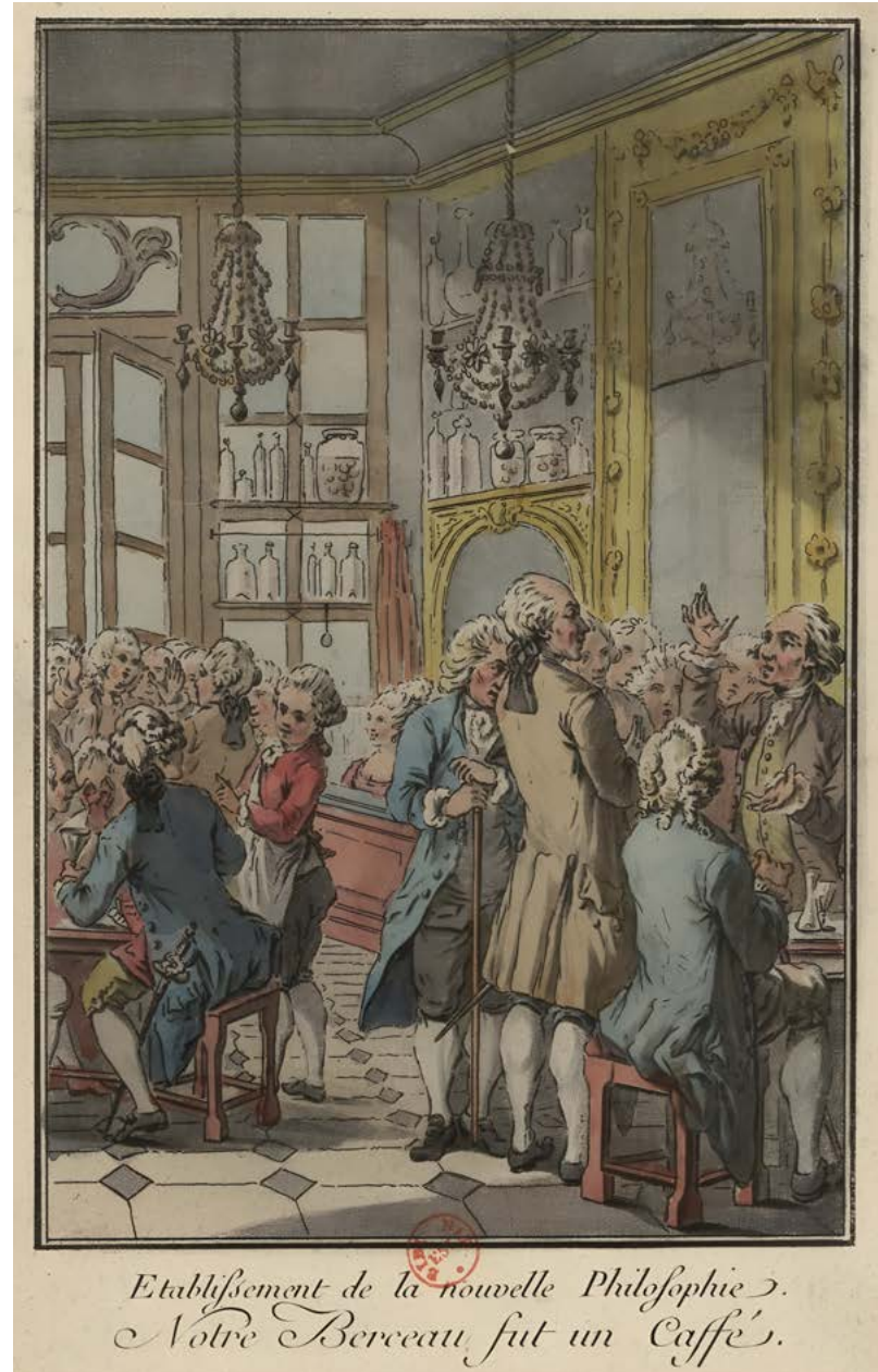
Vznik nové filozofie, naší kolébkou byla kavárna, francouzská litografie z roku 1779

Káva dorazila v polovině 17. století také do Británie a rychle vzbudila ohromný zájem. První britská kavárna byla otevřena v Oxfordu roku 1650. Není divu, že univerzitní myšlenky se filtrovaly nad kávou. Brzy následovala londýnská kavárna založená v roce 1652, kterou provozoval řecký obchodník Pasqua Roseé. I přesto ale britský pa-