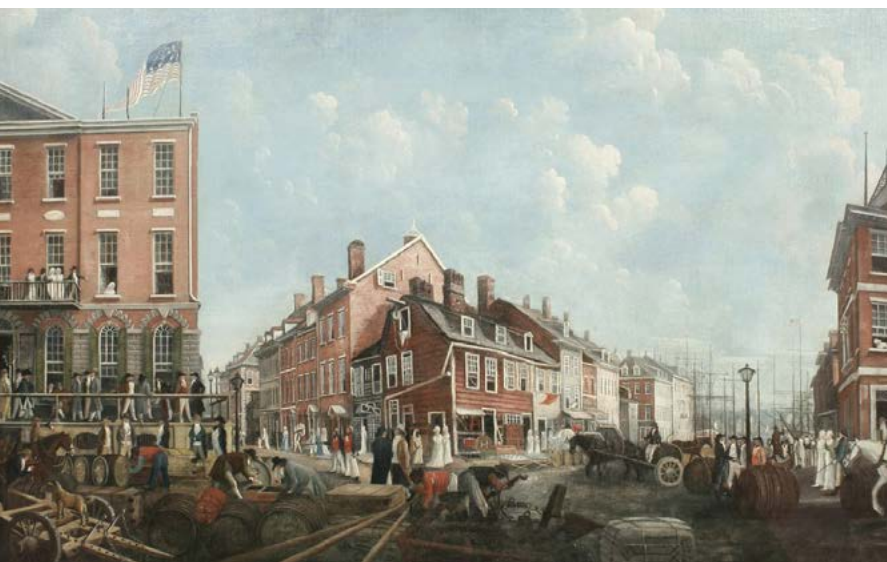
Olejomalba z roku 1797 zobrazuje v Tontine's Coffee House (vlevo) na nároží ulic Wall a Water Street

novník Karel II. v roce 1676 vyhlásil, že pití kávy je urážkou majestátu, ovšem Britové si kávu vzít již nenechali. Už před rokem 1700 bylo v království na dva tisíce kaváren. Tyto podniky se staly prostorem, který zásadně ovlivnil britskou kulturu – říkalo se jim „ penny universities “, protože vstup stál jednu penny a návštěvníci za něj získali nejen šálek kávy, ale i možnost poslouchat učené debaty, získávat informace nebo diskutovat o politice. V kavárnách vznikaly obchodní společnosti, noviny i vědecké spolky; například Lloyd's Coffee House , založený roku 1686 Edwardem Lloydem v Tower Street, je považován za přímého předchůdce dnešní pojišťovny Lloyd's of London . Z Jerusalem's Coffee House se zase vyvinula Východoindická společnost . Na rozdíl od Francie nebo Rakouska se britské kavárny staly především praktickými centry informací a obchodu. Káva se v Británii zprvu podávala převážně černá, bez mléka i cukru, někdy s kořením podobně jako v orientálním stylu. Postupně se však rozšířila sladší varianta, často s mlékem, avšak nikdy nedosáhla popularity britského čaje, který kávu v průběhu 18. století vytlačil z pozice nejoblíbenějšího nápoje.