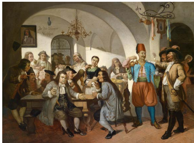
Atmosféra ve vídeňské kavárně U Modré lahve

Rakousko se sblíží s kávou po bitvě u Vídně roku 1683. Podle pověsti zůstalo ve městě po porážce Turků přes pět set pytlů s kávou, které získal Georg Kolschitzky, jenž otevřel roku 1685 první vídeňskou kavárnu Zur Blauen Flasche ( U Modré lahve ), v níž připravoval kávu na turecký způsob. Vídeňané však zastávali vůči nápoji úhlavních nepřátel velmi rezervovaný postoj, a tak se první vídeňská kavárna brzy ocitla na pokraji krachu. Kolschitzky brzy změnil strategii. Začal ve svém podniku přijímat hosty v tureckém převleku a zaváděl do nabídky i hudební pořady. Upravil také podávání kávy a začal filtrovat kávovou sedlinu, kterou vybraná klientela neměla ráda. Ke kávě začal nabízet sladké zákusky, nápoj zpestřil smetanou, mlé-