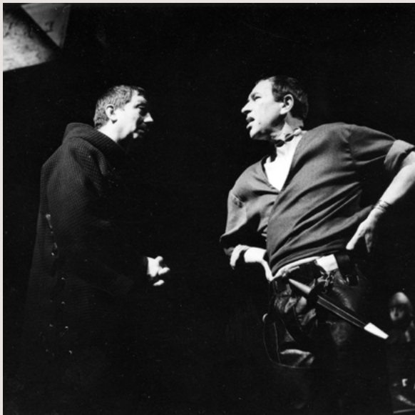
Diabol a Pán Boh

Na záver roka – 18. decembra – pripravila činohra SND inscenáciu v troch dejstvách Diabol a Pán Boh podľa francúzskeho filozofa a spisovateľa, hlavného predstaviteľa existencializmu – Jean-Paula Sartra. Goetz, hlavná postava, krutý vojak, chce dokázať svoju prevahu nad Bohom uskutočňovaním najhoršieho zla. Vypaľuje mestá, kruto ničí životy. Jeho oponent kňaz Heinrich mu hovorí, že konať zlo je ľahšie ako konať dobro,