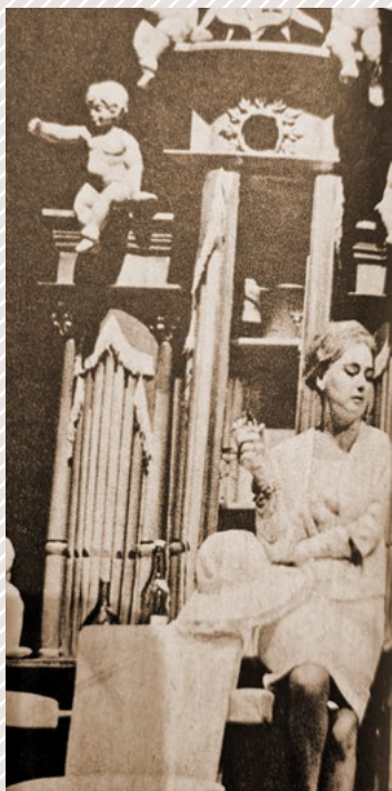
Zdena Gruberová Gustáv Valach