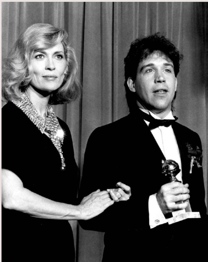
Tom Hulce, predstaviteľ Amadea a Faye Dunaway pri odovzdávaní cien Golden Globe Awards v roku 1985