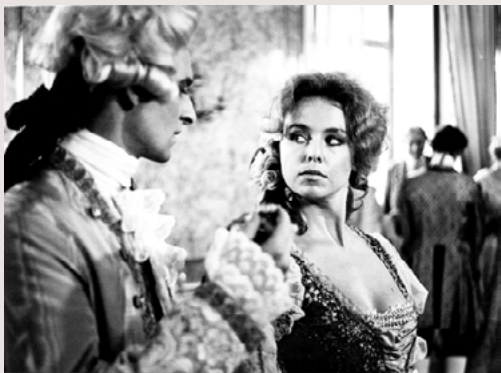
Zabudnite na Mozarta

Koprodukčný film (NSR) nemá ambície byť životopisným príbehom skladateľa (Max Tidof), ale na pozadí jeho smrti sa zamýšľa nad vzťahom umelca a spoločnosti, zmyslom umeleckej tvorby, nad cenou života a smrti, vinou, zodpovednosťou či svedomím. Film získal Zlatú plaketu za scenár na medzinárodnom festivale v Chicagu.