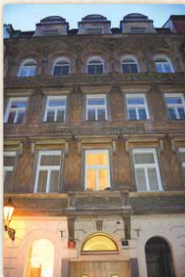
Dům U Straků (Benediktská 691/5)