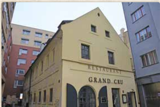
Nejkrásnější dům tohoto okrsku: Lodecká 181/4

a jeho chotí Kunhutou Štaufskou. Zakladatelčin odkaz pak můžeme doslova cítit v kapli Panny Marie i v její soukromé svatyni, zatímco každodenní život konventu nám připomene třeba unikátní otopná pec, později přestavěná na chlebovou.