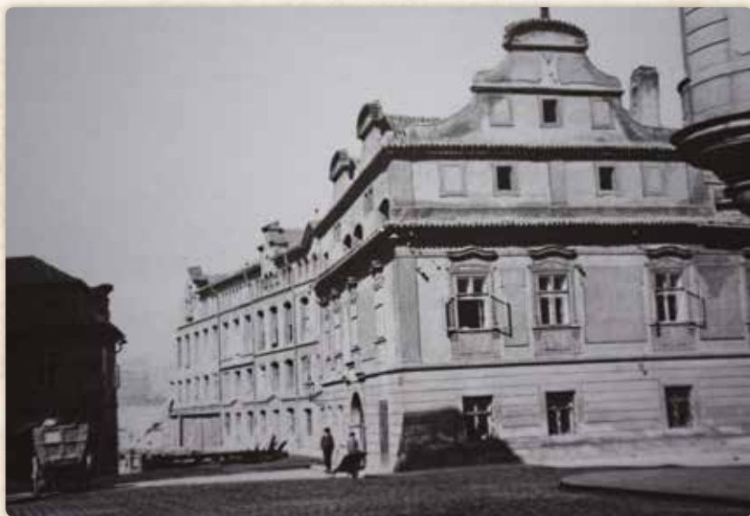
Freundův mlýn, tentokrát viděný od Samcovy ulice (kolem roku 1905)