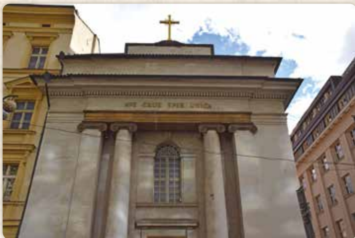
Na rohu ulic Na Příkopě a Panská patří do máchovského místopisu původně piaristický kostel sv. Kříže...

svými do něho mlátila, až z něj kolem stříkající bláto vyvěšené prádlo její nečistě vybělilo. Posléze se nebohému hromosvodu přece zdařilo utrhnouti se, který ihned dosáhnuté svobody ne zle užívaje do řeky dospíchal.