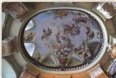
...i nad hlavou

To by nás dnes ani nenapadlo. Kamenné schodiště a terasa jsou pro mě neodmyslitelným „předpolím“, a stejně tomu bylo už dávno i v době, kdy sem nesli v zavinovačce novorozeně. A když se rodiče, kmotr a příbuzní vraceli do nedalekého příbytku, jejich drahocenný „náklad“ už měl jméno: Ignác (či spíše Ignaz, byť se nám to jako Čechům nemusí líbit). Chlapec byl pokřtěn pod ochranou už tehdy široce uctívané-