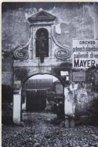
Ještě v roce 1920 byl Anežský klášter takto znehodnocen (severní portál, čp. 811-I)