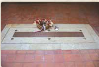
Hroby přemyslovské nekropole: král Václav I.