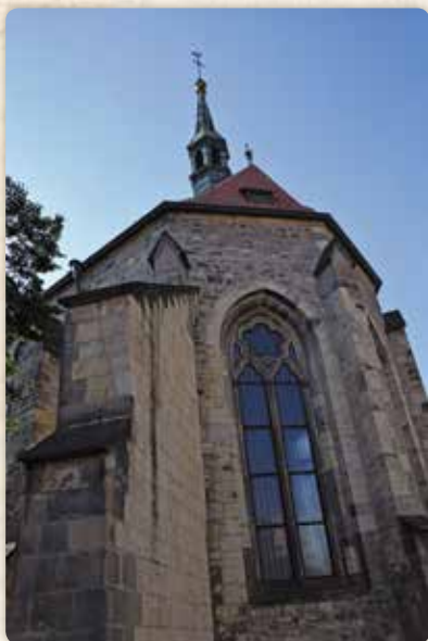
Kostel svatého Salvátora...