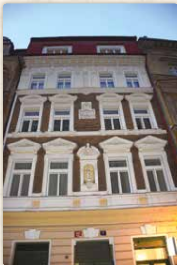
A ještě jedna máchovská adresa, Benediktská 690/7

Ano, dá se pochopit, že Vltava musela být regulována; během první světové války tak zmizely Dolní Lodecké mlýny. Ovšem „vesele“ a bez ohledu na řeku tu bylo bořeno i nadále. Do čtyřicátých let minulého století došlo k demolici třeba renesančních čísel popisných 1225 a 1226, pravda, přinejmenším navenek zchátralých; ale bez milosti byl zbořen také Freundův mlýn (číslo popisné 1224), v jádru gotický a s mohutnými renesančními štíty. Patřila k němu dokonce salla terrena (čp. 1318), kterou byste v této části Prahy nečekali... Stejný osud potkal třeba nádherně asymetrický dům číslo popisné 1182 na rozhraní ulic Lodecká a Samcova. Věřím, že se jeho neobvyklost přitahovala i malého Máchu; objekt renesančního původu s barokní fasádou zmizel z povrchu zemského v roce 1940. A nepřežilo