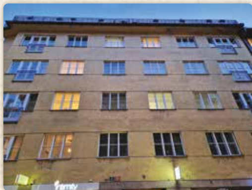
Máchovská adresa Benediktská 689/8

Posledně jmenovaná dostala jméno podle Lodeckých mlýnů (přesněji řečeno Dolních Lodeckých – Horní Lodecké stávaly u Žofína, na dnešním Masarykově nábřeží). Mlýny poblíž Máchova bydliště, to jest mlýny Dolní Lodecké, Lodkové či Lodní, jak se jim také říkalo, rovněž nenávratně zmizely v běhu času. A když vidíme jejich krásu, je to velká škoda.