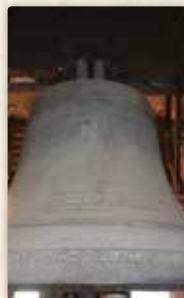
...a těšil se na vzrušující zážitek při vyzvánění!