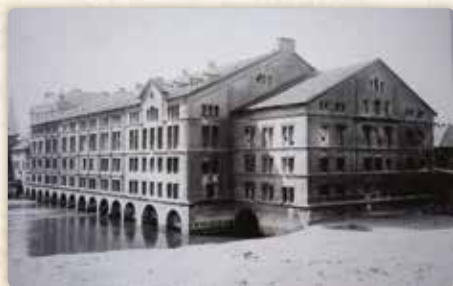
Ještě jeden pohled na Dolní Lodecké mlýny krátce před jejich zbořením (1909)