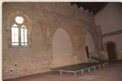
Sousední kostel svatého Františka...