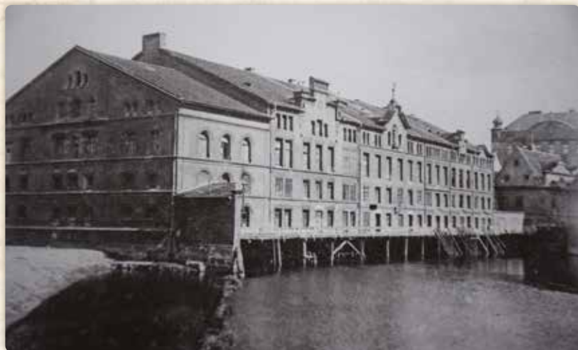
Dolní Lodecké mlýny od severovýchodu. Po požáru starých, dřevěných, dostaly jednotnou romantickou fasádu, pod níž se skrývalo sedm samostatných, majetkově oddělených provozů. Násyp vlevo je spojoval s Korunním ostrovem. Vpravo v pozadí Freundův mlýn a Špačkův dům (s nárožními věžičkami – viz pátá kapitola)