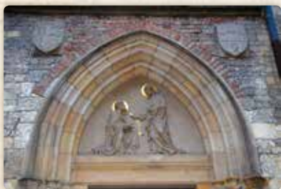
Tympanon nad vchodem do svatyně