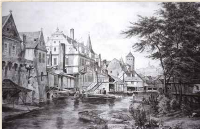
Bedřich Havránek: Laguna mezi Novými a Dolními Lodeckými mlýny (akvarel, 1853)