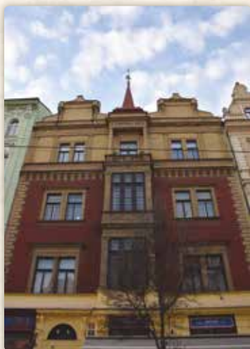
Dům U Černého orla (Újezd 402/33)

K básníkově skonu se dostaneme později. Nyní vstupme