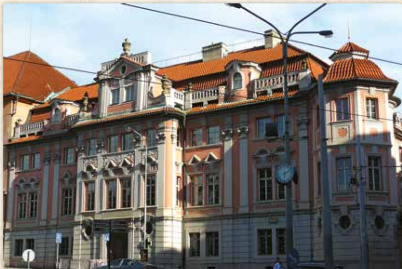
Dvě legendární stavby Karlova náměstí: dochovaný Faustův dům...