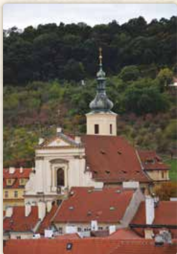
Kostel Panny Marie Vítězné, viděný z Malostranské mostecké věže