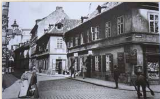
Jižní strana Benediktské ulice, průhled od nároží s Rybnou (foto Jindřich Jaksch, kolem roku 1912)

Adresu Mlýnská čp. 1182/II, dům zvaný U Horských, nenajdeme ve vyhledávacích ani v reálu. Předminulé století, a pře-