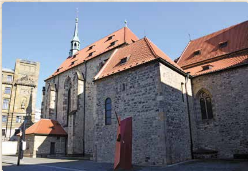
Anežský klášter, sluncem zalitý