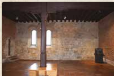
Konventní budova: kapitulní síň