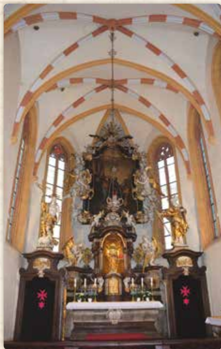
Ještě jednou navštívíme kostel svatého Petra