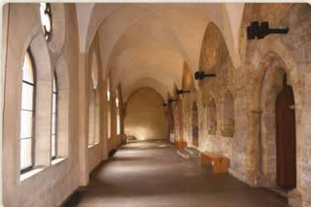
Konventní budova: křížová chodba

Sousedsky malebnou Malou Stranu a sluncem prozářenou straň pod Petřínem jsme nechali za zády. Ocitáme se v zákoutích ještě chudších – a výrazně ponuřejších. Ovšem voda v krajině, to