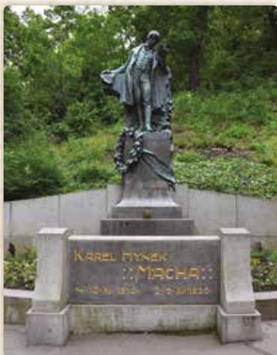
Máchův pomník na Petřině od J. V. Myslbeka