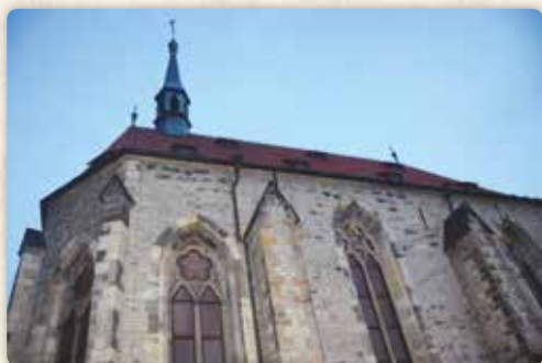
Kostel svatého Salvátora v areálu Anežského kláštera

a jako by jejich zvuk rozkmital paprsky světla, padající dovnitř okny v kopuli. Pohyb stínů dodával zdání živosti přísným bělostným sochám světců. Ve vnímavé chlapecké duši zanechaly tyto zážitky hluboký dojem. Zdálo se,