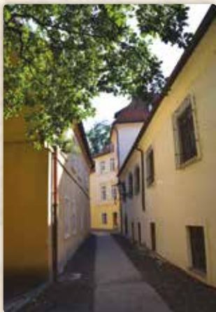
Dub Na Řásnovce tam tehdy ještě nerostl, jinak by na něj Ignác jistě lezl

Šťastná léta však brzy skončila. Rakousko se po napoleonských válkách dostalo do finančních potíží, nastal hospodářský krach a těžká krize, řešená v roce 1811 měnovou reformou.