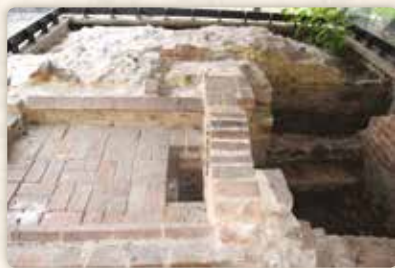
Venku nacházíme unikátně dochovanou chlebovou pec

Co mohlo budit Ignácův zájem o bájnou a hrdinskou historii? Třeba právě petrský Biskupský dvůr, jehož některé budovy, byť v přestavěné podobě, dožívaly až do roku 1931. Výraznější památky se skví na náměstíčku sevřeném ulicemi Petrská a Biskupská.