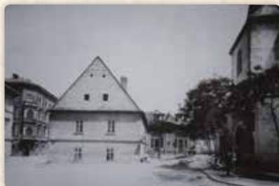
Ještě jeden pohled na Petrskou školu, doslova v předvečer její demolice (foto Jindřich Eckert, 1894)