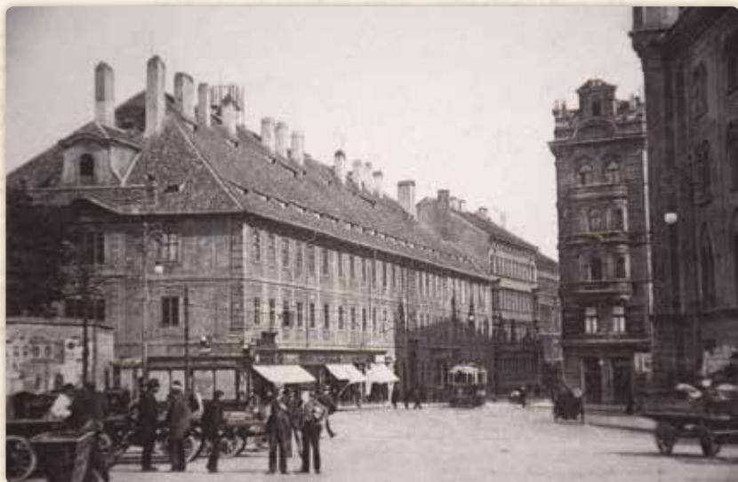
Novoměstský ústav šlechtičen, který vystřídal zrušené Norbertinum (a ocitl se tím pádem na Starém Městě), kolem roku 1900