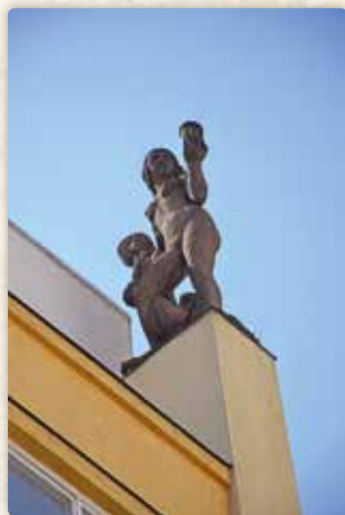
Socha symbolizující naději od Ladislava Beneše na paláci Kotva

Pro úplnost dodejme, že v místech ministerstva dopravy a o něco jižněji byly ještě mlýny Helmovské či Helmovy – soubor osmi mlýnů, zbořený až ve třicátých letech minulého století (odtud i jméno Helmovy ulice) –, jakož i Stárkův parní mlýn. Ten je novější, takže ho Mácha neviděl; jinak ale žil po jis-