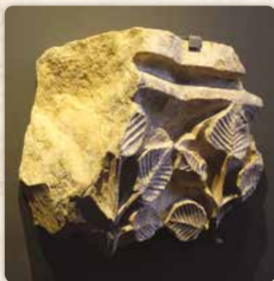
Z nádherné výzdoby Anežského kláštera: fragment hlavice s lipovými listy

je něco, co mě vždy neodvratně přitahuje. A jak sugestivně popsal kolega Otomar, v případě party kluků toužících po dobrodružství musela být taková přitažlivost ještě silnější.