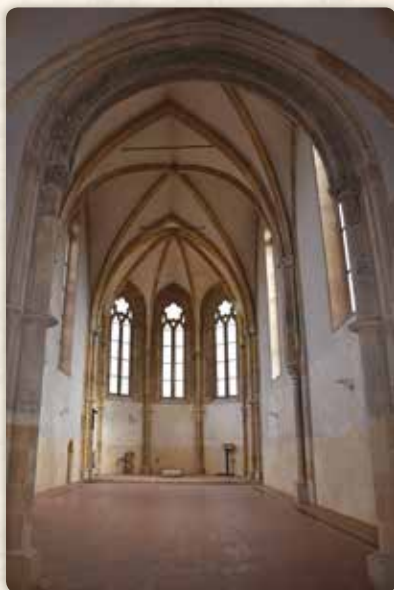
...a jeho interiér