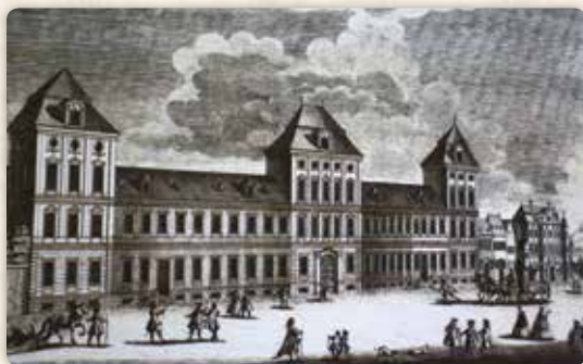
Novoměstský ústav šlechtičen na jižní straně Dobyčtího trhu před svým přeložením do Trubní (dnes Revoluční) ulice. Vpravo Faustův dům čp. 502 již po barokní úpravě. F. B. Werner, mědirytina, kolem r. 1740

no přiznat, že ani on ve své komůrce nesetřával déle, než bylo nutné. Pokud jen mohl, vydával se ven, na dlouhé vycházky. Samotné okolí bydliště mu nabízelo mnoho vzrušujících tajemství, vábících jeho nepokojnou mysl.