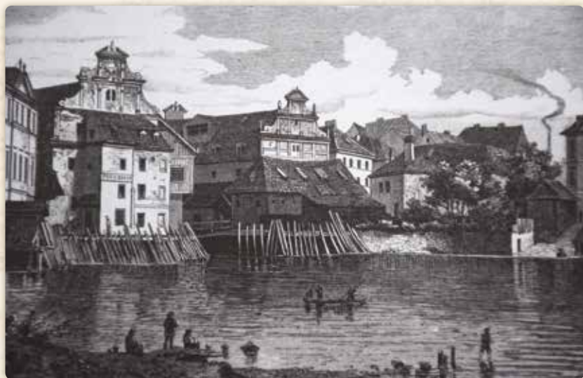
Bedřich Wachsmann: Laguna před Helmovými mlýny od Korunního ostrova (xylografie, 1884)