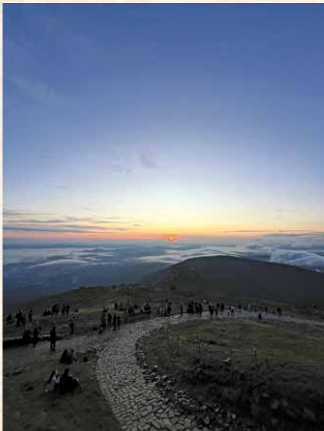
Úsvit viděl Mácha...

a v neposlední řadě překvapivě chladný počtář a pragmatický obchodník.