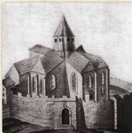
...a zaniklá kaple Božího Těla

a temnou komoru (snad původně nějaké skladiště), která měla jediné okénko do špinavého dvora. Michal se v ní příliš nezdržoval; pobýval ve mlýnské šalandě a doma se stavoval jen k nedělním obědům. Tím pádem tam býval