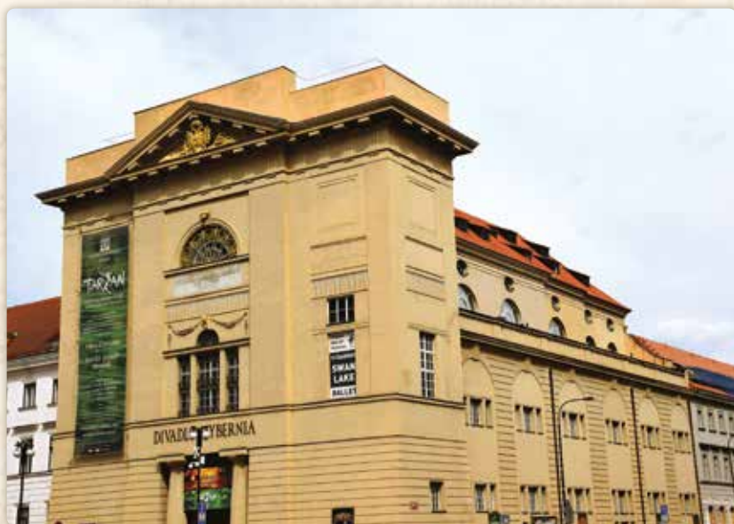
Dnešní podoba domu U Hybernů

Josef II. sice nezáviděl, ale považoval Norbertinum za zbytečné. A tak tento bohulibý ústav zrušil. Po krátkém armádním intermezzu sem byl z Dobytčího trhu přenesen Novoměstský ústav šlechtičen u svatých Andělů; na Dobytčím trhu alias Karlově náměstí, kam se záhy vypravíme, se nacházel v současné