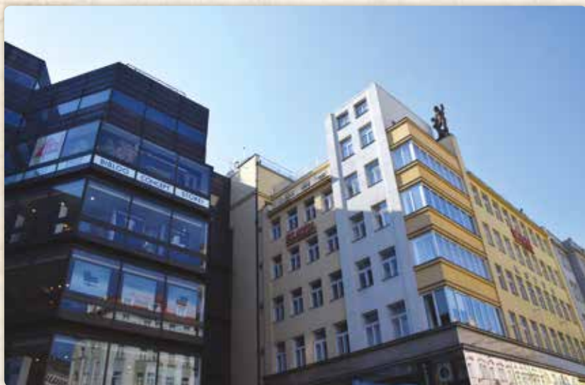
Dnešní podoba místa, kde stávalo Norbertinum. Vlevo obchodní dům Kotva, vedle něj palác Kotva (náměstí Republiky 655/9, resp. Revoluční 655/1)

mnohem vyšším novostavbám, které ho svírají z obou stran. Působný je i díky vysokým bílým komínům. Až se dostane také na severní fasádu, bude to paráda!