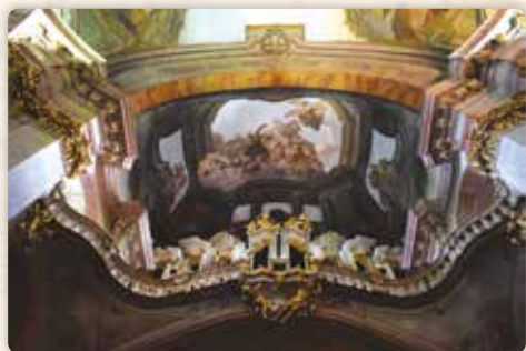
Pohled zdola na kůr s varhanami v chrámu svatého Mikuláše

Oba současné domy jsou udržované a hezké; přes tramvajové vedení nám ukazují vkusná průčelí. Totéž platí pro objekt na druhé straně od „Máchova rodného“, tedy pro adresu Újezd 402/33. Zajímavé je, že nese název U Černého orla. Takže tu máme černobílou dvojici těchto symbolických dravců. A neméně zajímavé, že to není jediný dům