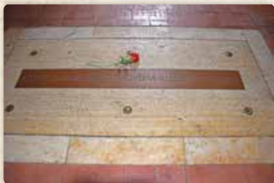
Hroby přemyslovské nekropole: královna Kunhuta Štaufská, manželka Václava I.