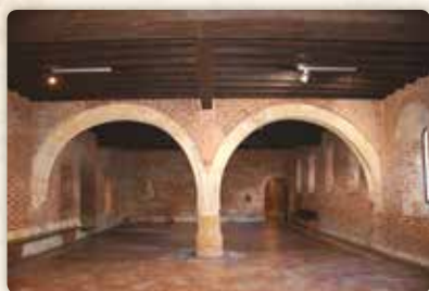
Konventní budova: refektář a pracovna sester