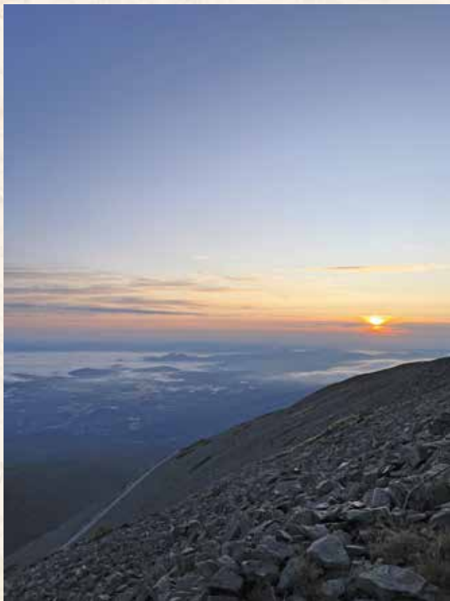
...mimo jiné ze Sněžky

stal vyzrálým jako Hugo či Goethe), suverénní řečník a herec, neúnavný cestovatel a člověk, kterého bychom dnes nazvali sportovcem, nakonec i hudební Múzou políbený mladík –, a stojí před Vámi Někdo s velkým N. Když k tomu přidáme fakt, že Máj v našich literárních poměrech předběhl dobu (ba v jistém ohledu nebyl „dohnán“ dodnes), Máchův stupňující se