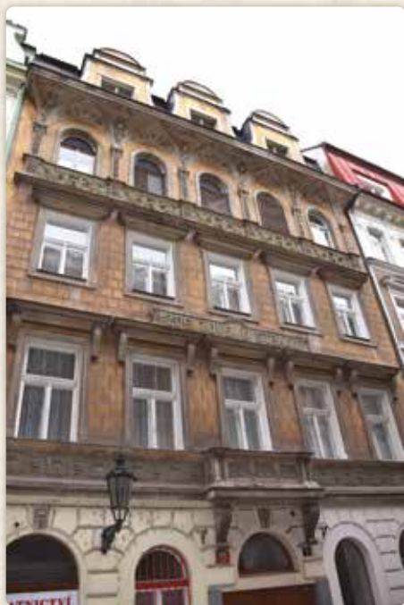
Jeden z hezčích domů v sousedství Máchových bydlíšť: Benediktská 691/5

Zato situace rodiny byla čím dál horší. Výdělků klesaly a padesátiletý mlynář Mácha už na fyzicky náročnou práci nestačil. V roce 1822 se museli přestěhovat do ještě levnějšího podnájmu – tentokrát do Benediktské ulice, která se nacházela v těsné blízkosti jedné z nejobozejších pražských čtvrtí: Na Františku. Stěhovali se dokonce dvakrát – nejdříve do domu čp. 689, následně ve stejné ulici do čp. 690, zvaného U Bomovských.