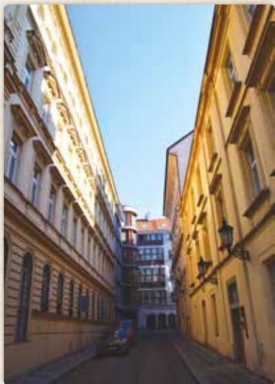
Helmova ulice. Místo romantických zákoutí jen stísněnost mezi fádními budovami