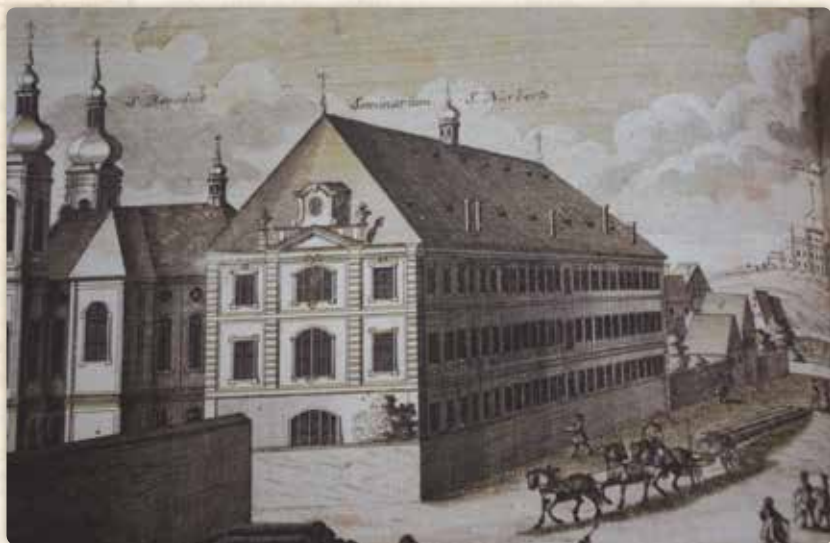
Norbertinum (mědiryt, kolem roku 1740, F. B. Werner, ryl I. G. Ringle). Průhled do Trubní (dnes Revoluční) ulice od Králova dvora. Vlevo kostel svatého Benedikta

ani číslo popisné 1218. Všechny tyto „zemřelé“ vidíte také na fotografiích.