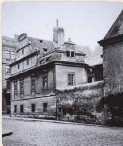
Freundův mlýn od Klimentenské ulice (kolem roku 1910)