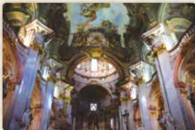
Interiér je barokním skvostem...