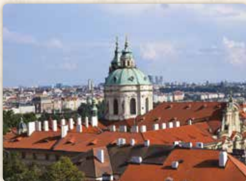
...a do chrámu svatého Mikuláše chodil poslouchat dědečka varhaníka