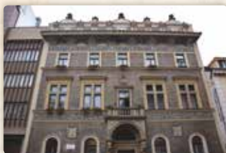
Novorenesanční fara u svatého Petra v Biskupské ulici