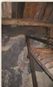
...stoupal po schodech...