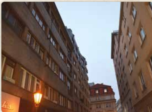
Další z bydlíšť rodiny Máchovy, Benediktská ulice, za podzimního soumraku