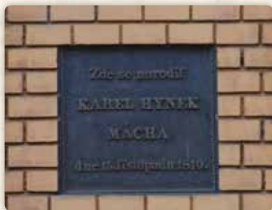
...jak o tom svědčí pamětní deska

A přesto právě tady, na úpatí mýtického vrchu Petřína, té kdysi skalnaté hory plné starých lomů a vodních pramenů, se v mlhavém, dušičkovém čase 16. listopadu 1810 narodil skutečný Ignác Mácha. Bylo to na Újezdě poblíž tehdejší Kartouzské brány, kudy se vyjíždělo z Malé Strany k osadě Smíchovu. Jeho rodný dům U Bílého orla (s domovním znamením dvouhlavého bílého orla mezi okny prvního patra) měl v přízemí krámk se smíšeným zbožím a hospodu. Máchovi prý bydleli v mansardě, v půdní nástavbě vystupující ze střechy průčelním oknem. Na dobovém obrázku vidíme, že tyto mansardy bývaly dvě. Dům už neexistuje, byl zbořen při rozšiřování ulice a nahrazen novostavbou. Ani sám Mácha si na něj patrně příliš nepamatoval; žil zde do svých šesti let.