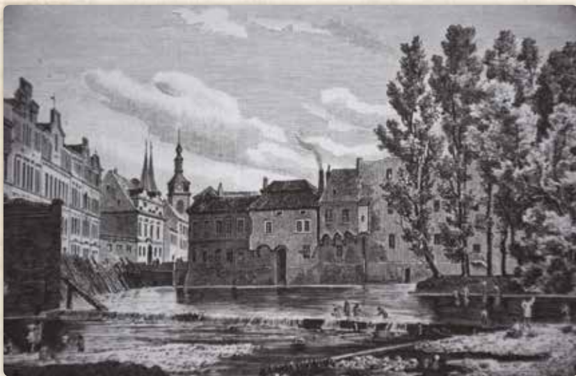
Bedřich Wachsmann: Laguna před Dolními Lodeckými mlýny (xylografie, 1884)