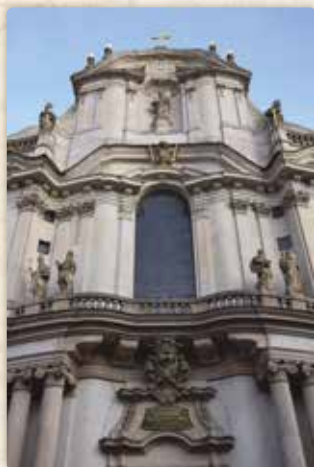
Vstup do chrámu svatého Mikuláše