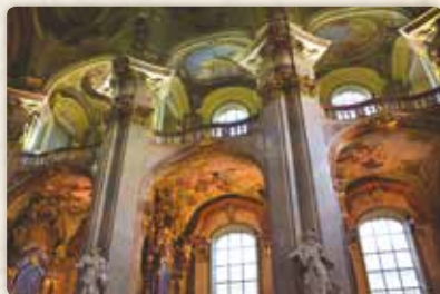
...který můžeme obdivovat kolem sebe...

dvojím způsobem – jednak proměnou z luteránské na katolickou a jednak tím, že se původní vchod nacházel na druhé straně.