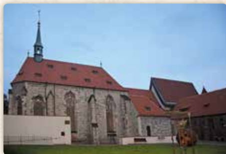
Kostely svatého Salvátora a svatého Františka