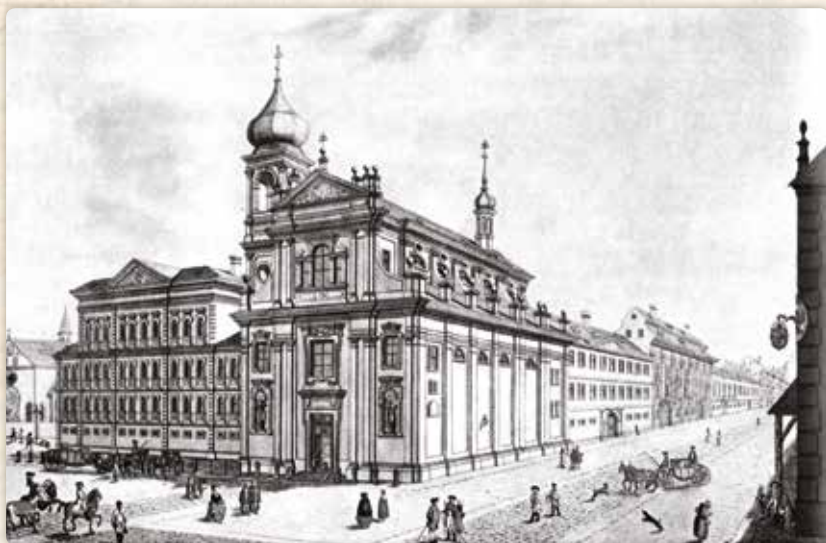
Nároží Hyberské ulice s kostelem svatého Ambrože (Josef Antonín Scotti de Cassano, 1785)

no slovy dalšího klasika: Nuda, nuda, šed', šed'... (respektive nevyrazná a zašlá žluť).