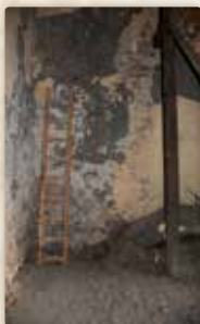
Tudy do zvonice vstoupil malý Ignác...

Proč právě do Seminářské zahrady? Kromě její odlehlosti nám důvod prozrazuje Máchův spolužák (a obdivovatel) Václav Mach ve svých Akademických pamětech . Dočítáme se