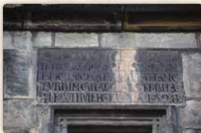
Pamětní deska na zvonici dosvědčuje její vysvěcení v roce 1598

Ke klášteru bosých karmelitánů kdysi patřila dodnes existující Seminářská zahrada. V jinošském věku do ní chodíval i Karel Hynek. Ovšem nevedla ho k tomu nostalgie po ztraceném dětství, jak by Vás možná napadlo. V dobách, kdy veřejně zpívat české písně nebylo bez rizika a ti, kteří tak činili, se vystavovali možnému postihu, si sem on a jeho spolustudenti chodili zapět v rodném jazyce.