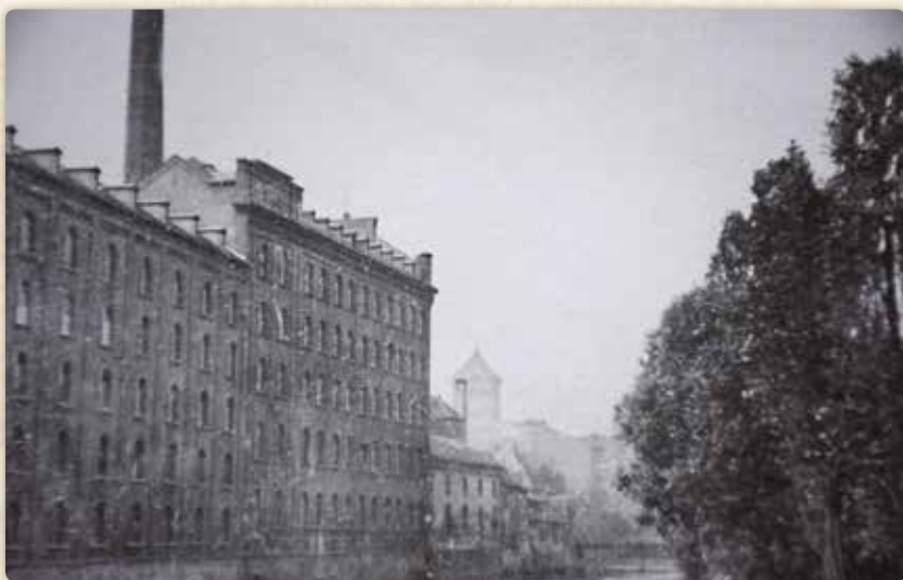
Břeh Petřské čtvrti viděný od Dolních Lodeckých mlýnů už nabízí kolem roku 1905 méně půvabný pohled. V této továrně vyráběla firma Carl Breiding & Sohn kovové pružiny