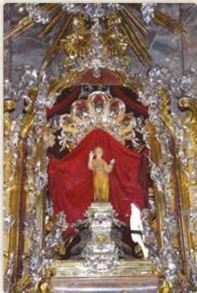
Nejen o Vánocích se můžeme poklonit Pražskému Jezulátku

Severním sousedem je pak dům s adresou Újezd 400/37.