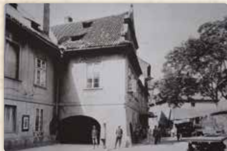
Klimentská ulice u domu čp. 1218. V pozadí gotická partie Freundova mlýna (foto Jan Kříženecký, kolem roku 1910)

především Wiehl a Klouček. Stojíte-li před průčelím, neunikne Vám, jak necitlivě je po Vaší levé ruce připojen vjezd do sousedního hotelu. Ještěže alespoň barevnost jakžtakž ladí!