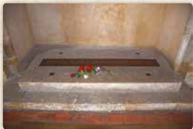
Hroby přemyslovské nekropole: svatá Anežka Česká