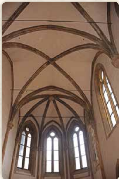
...dal jméno celé čtvrti