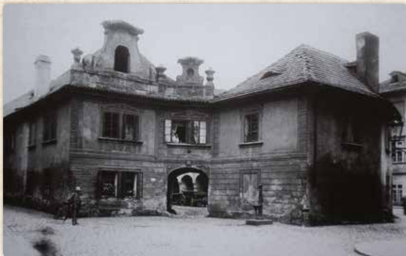
Dům čp. 1182 mezi Lodeckou a Samcovou ulicí (kolem roku 1910)