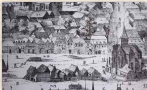
Část východní strany Dobytčího trhu mezi Žitnou a Ječnou ulicí. Vpravo kaple Božího Těla. Filip van der Bossche, tzv. Sadelerův prospekt, mědirytina, 1606

Ke krámku přiléhala malá kuchyňka, kde staří Máchovi i spávali. Dospívajícím synům ponechali k užívání úzkou