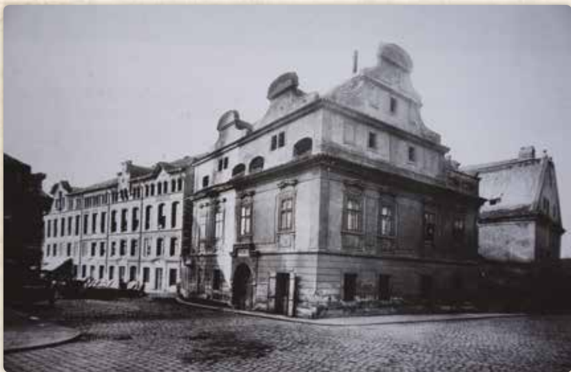
Další pohled z Klimentovské ulice na Freundův mlýn a řadu Dolních Lodeckých mlýnů