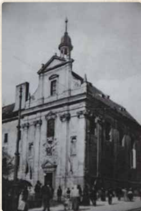
Kostel svatého Vojtěcha od Celetné ulice (1902). Svatyně byla nejprve součástí arcibiskupského semináře, pak sloužila jako pražský posádkový kostel... Ani to ji neuchránilo před zbořením

Zato druhá máchovská adresa, Benediktská 689/8, ve své současné podobě zcela postrádá jakýkoli nápad, invenci, šarm... Kdyby šel básník kolem, asi by ho (stejně jako mě) zaujala jen prodejna dámského prádélka v přízemí. Jinak, řeče-