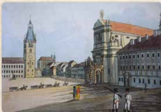
Jsmo v době Máchova narození – kolorovaný lept A. Gustava byl pořízen kolem roku 1810. Jeho středobodem je kostel sv. Ignáce na Dobyčtím trhu

Například hned v sousedství se nacházel nárožní dům U Kamenného stolu, tehdy už hodně zchátralý. Co vedlo k jeho názvu? Zřejmě tady skutečně stával kamenný stůl, u něž městský zřízenec vybíral poplatek z dobytka, hnaného na Dobyčtí trh. Také se říkalo, že ten stůl sloužil řezníkům k pouličnímu prode-