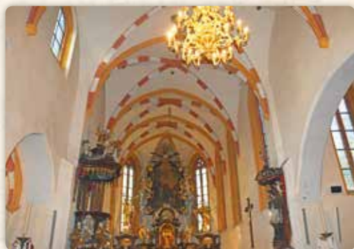
Interiér kostela svatého Petra

Alespoň náznak zeleně nám u svatého Petra zbyl