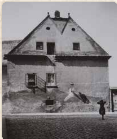
Dolní Lodecké mlýny, část přiléhající k pevnině (1909)