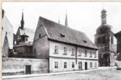
Petrská škola a kostnice v roce 1890, tj. krátce před zbořením – a v podobě, které nabyly až po Máchovi

A kostel svatého Mikuláše s bývalým profesním domem jezuitů, jenž