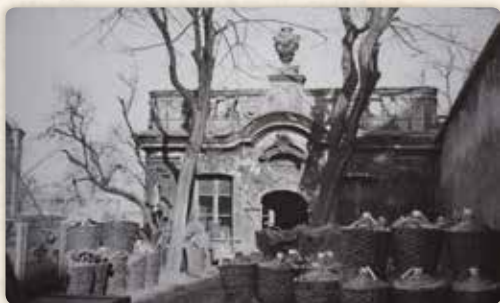
Demoliční čety nešetřily ani barokní sálu terrenu čp. 1318, patřící k Freundovu mlýnu (foto František Fink, kolem roku 1905)

V kostnici, tedy alespoň podle legend, bývalo „veselo“ i jindy. Za detaily vděčíme Františku Ruthovi (překvapivě ani zde, ani na dalších adresách Máchu nezmiňuje). Jak vypravuje slovatný autor Kroniky královské Prahy a obcí sousedních ,