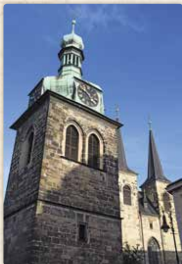
Zvonice u svatého Petra, která se Máchovi málem stala osudnou