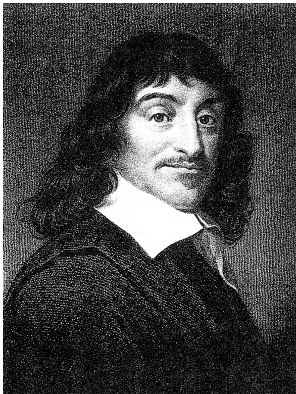
Obr. 1 René Descartes

světem své soukromí i nejdůležitější myšlenky a důvěřoval především svému vlastnímu úsudku. Nejplodnějším obdobím Descartova života byl dvacetiletý pobyt v Holandsku (od roku 1629), kde pobýval raději než v rodné Francii, a to pravděpodobně kvůli vnější i vnitřní nezávislosti. V roce 1649 odjel Descartes na pozvání královny Kristiny do Švédska, kde však brzy podlehl vlivům nezvyklého klimatu. Královna Descarta nutila, aby ji vyučoval od pěti hodin ráno ve špatně vytopené knihovně. Po čtyřech měsících se francouzský učenec nachladil a zemřel na zápal plic (Schultz, Schultz, 1992, s. 31–32; Störig, 1995, s. 228).