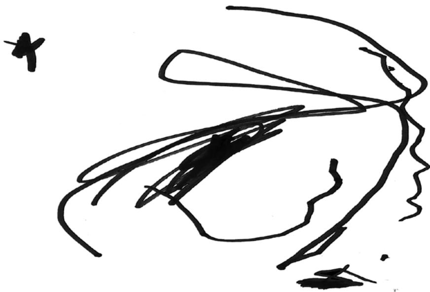
Obr. 1 Kresba čmáranice, děvče 2 roky a 1 měsíc

Po nakreslení děvče ukáže prstem na obrázek a řekne: „To je pejsek, haf!“ Dospělý reaguje projevem zájmu a sdělí: „A co je tady toto (vlevo nahoře)? To je včelka?“ Dítě následně začne na nový papír malovat podobné tvary, které komentuje slovy: „Včelka, včelka.“