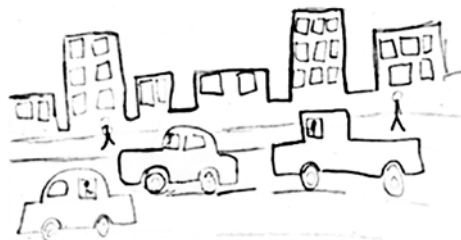
Obr. 3 a 4 Kresby s prvky vztahujícími se k nouzovému stavu v období karantény v první vlně pandemie, děvče 9 let

Děvče žijící v USA během první vlny pandemie nakreslilo matku v roušce. Po uzavření školy dívka doprovázela svou matku každý den do práce, aby nebyla doma sama. Ve snaze dítě zaměstnat jí matka zadávala různé úkoly včetně „namaluj mi nějaký obrázek“. Obrázek odráží tehdejší aktuální stav a nové zkušenosti, kdy svou matku vídala často zcela nezvykle s rouškou na obličeji. Na druhém obrázku děvče znázornilo nový pohled na vyčistěnou ulici v Lynchburgu (Virginie), která je za běžných okolností přeplněna auty a lidmi.