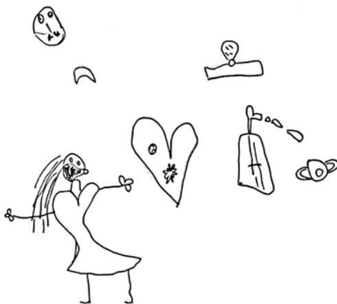
Obr. 5 Coronavirus a karanténa, děvče 5 let a 2 měsíce

Děvče žijící v USA během první vlny pandemie nakreslilo matku v roušce. Po uzavření školy dívka doprovázela svou matku každý den do práce, aby nebyla doma sama. Ve snaze dítě zaměstnat jí matka zadávala různé úkoly včetně „namaluj mi nějaký obrázek“. Obrázek odráží tehdejší aktuální stav a nové zkušenosti, kdy svou matku vídala často zcela nezvykle s rouškou na obličeji. Na druhém obrázku děvče znázornilo nový pohled na vyčistěnou ulici v Lynchburgu (Virginie), která je za běžných okolností přeplněna auty a lidmi.