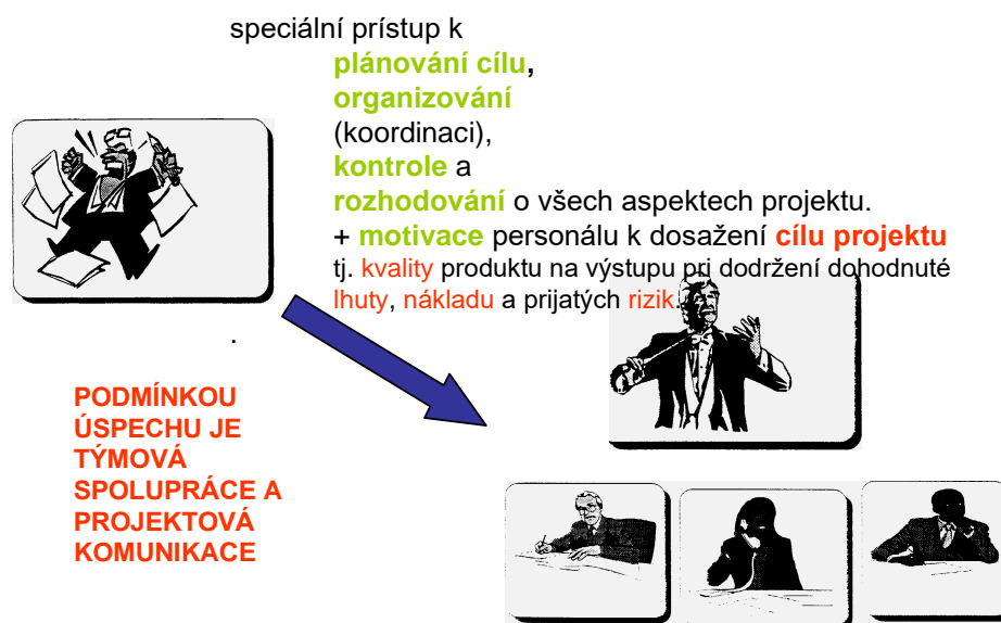
Obrázek 2 Co je projektové řízení

V 70. letech minulého století nastupují informatika a počítačové podpory, které dávají projektovému řízení novou dimenzi. Projektové řízení se stává v ekonomicky vyspělých zemích diskutovaným tématem. Zjistilo se, že projektové řízení může být užitečné při zvládnání změn i v řadě dalších oblastí lidské činnosti. Pozornost, zejména v USA a v západní Evropě, se přesunula k řízení rozsáhlých a složitých projektů průmyslových inovací a souvisejících investic ve výstavbě.